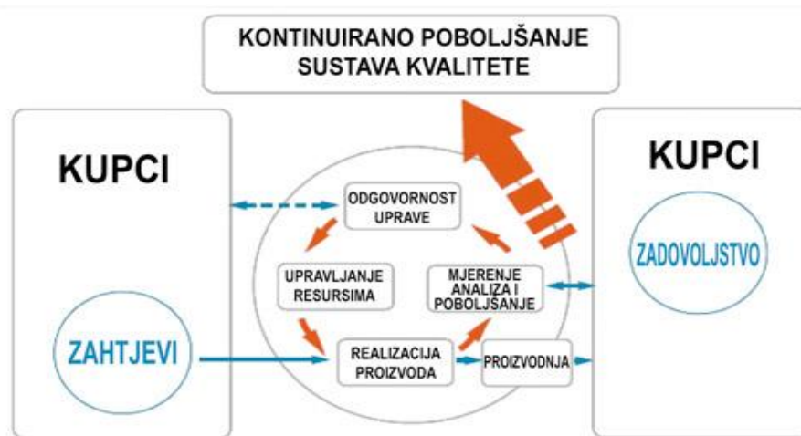
Slika 2. Procesno zasnovani model sustava kvalitete