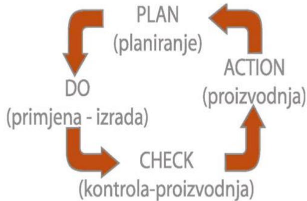
Slika 1. Shema PDCA kruga