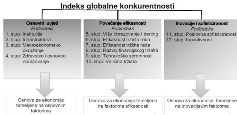
Slika 3. Indeks globalne konkurentnosti