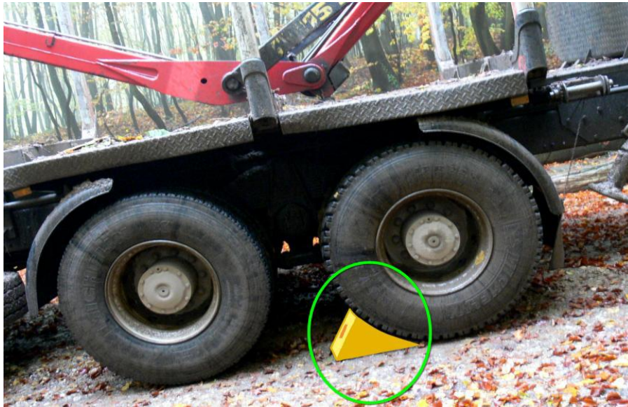
Slika 3. Osiguranje vozila

Na nizbrdici prije utovara ili istovara vozilo treba zakočiti i pod kotače postaviti klinastu podlošku.