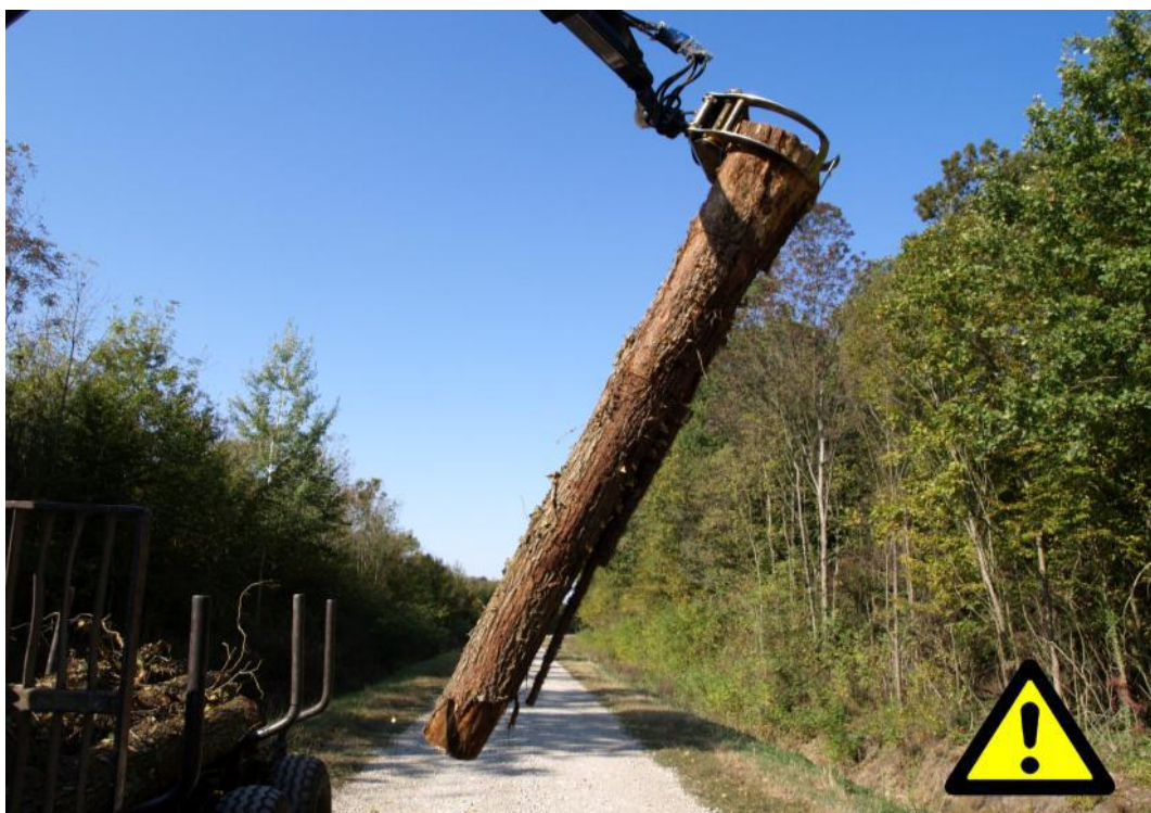
Slika 6. Neispravno obuhvaćen trupac