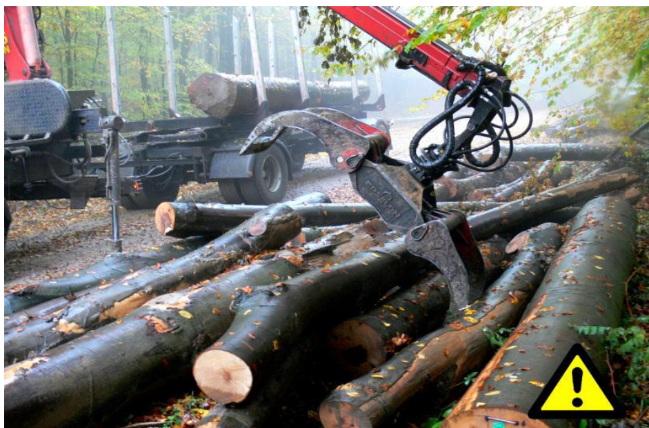
Slika 7. Izvlačenje sortimenata iz hrpe

Kod veće hrpe treba najprije utovariti one drvene sortimente koji nisu ukliješteni. Zabranjeno je izvlačenje drvnih sortimenata iz sredine hrpe.