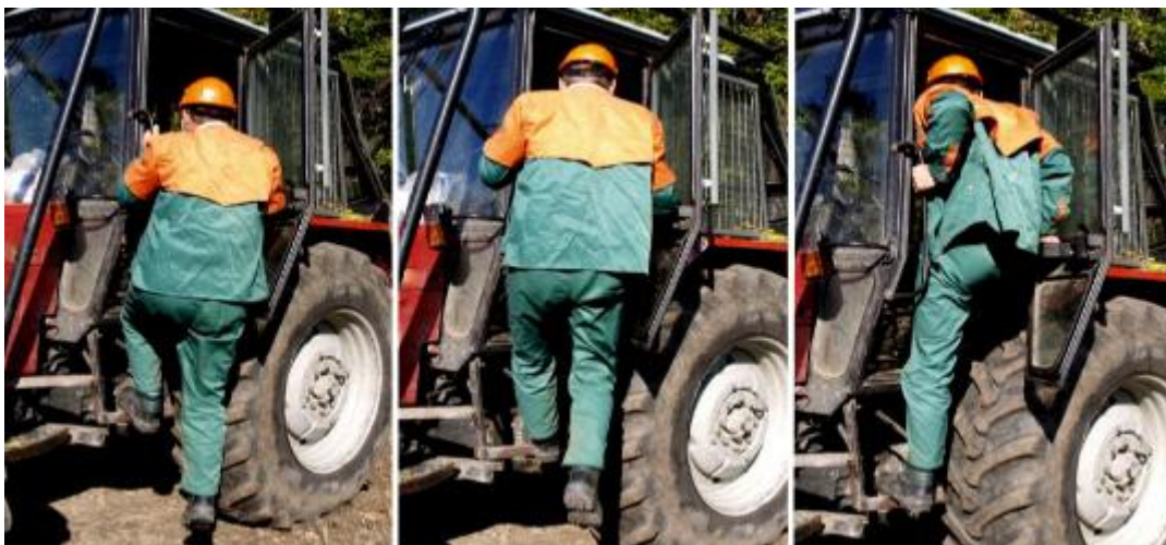
Slika 11. Nepravilan izlazak iz stroja