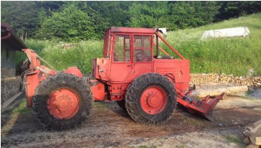
Slika 9. Sklopovi traktora