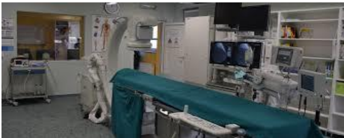
Slika 7. Laboratorij za kateterizaciju srca

Do kraja 2017. godine Thalassoterapija će ući u kategoriju srednjih centara s 200 do 600 intervencija. Cilj je povećati broj „ad hoc“ intervencija, te značajnije povećati aplikaciju DES-ova. (Peršić, 2017.)