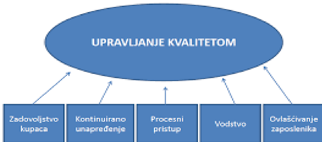
Slika 2. Upravljanje kvalitetom