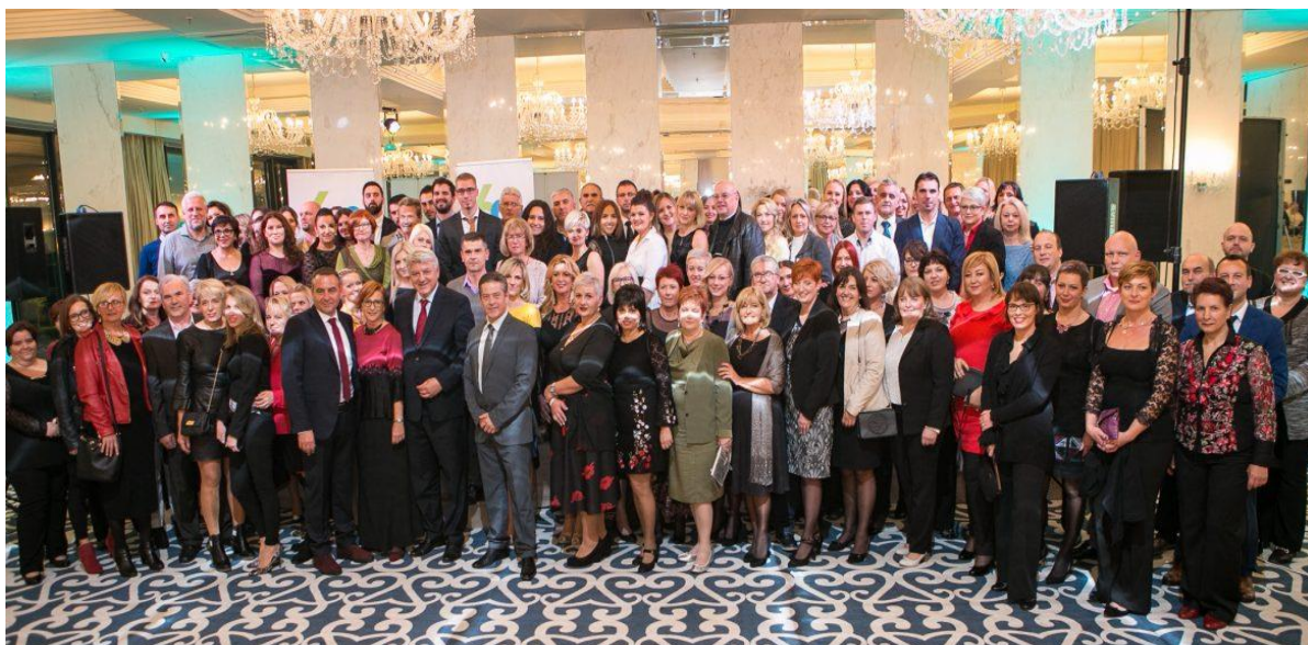
Slika 6. Obilježavanje šezdesete obljetnice osnutka Thalassotherapie Opatija

Na šezdeseti rođendan Thalassotherapie može s ponosom pokazati što ima i što zna. Pored vrhunskih prostora i opreme, njena stručna i poslovna suverenost, temelji se na sposobnom timu koji spremno dočekuje izazove za budućnost.