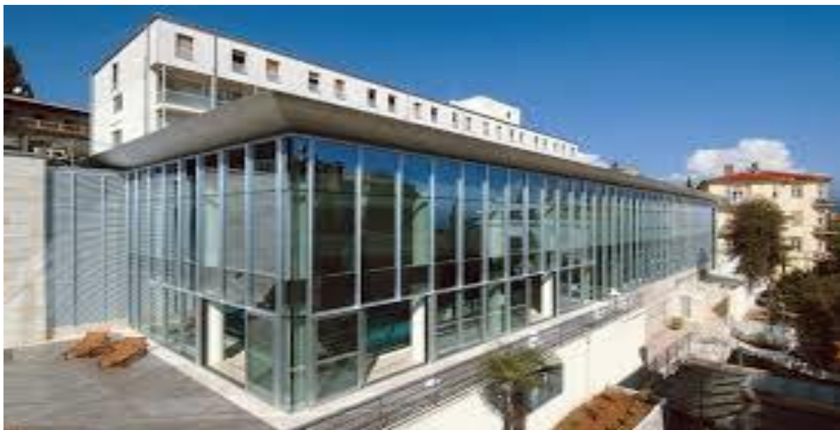
Slika 8. Thalasso Wellness Centar

Marketinške aktivnosti su usmjerene prema izgradnji imidža centra izvrsnosti medicinskog wellnesa s educiranim stručnim osobljem, a sama promocija proizvoda zdravstvenog turizma ima za cilj isprofilirati imidž Thalassoterapije Opatija i Thalasso Wellnes Centra kao zdravstvenog i znanstvenog brenda i lidera zdravstvenog turizma Opatije, Kvarnera i Hrvatske. (Bratović, 2007.)