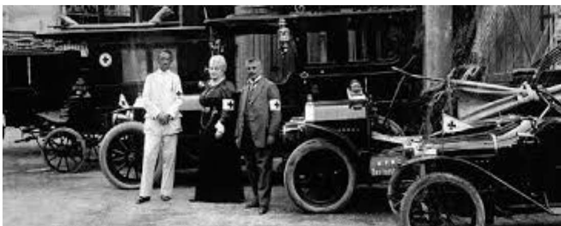
Slika 4. Prva spasilačka zdravstvena služba u Opatiji