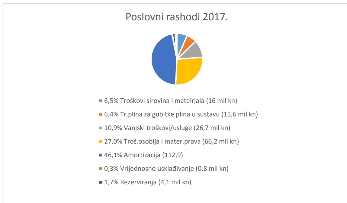
Grafikon 2. Poslovni rashodi