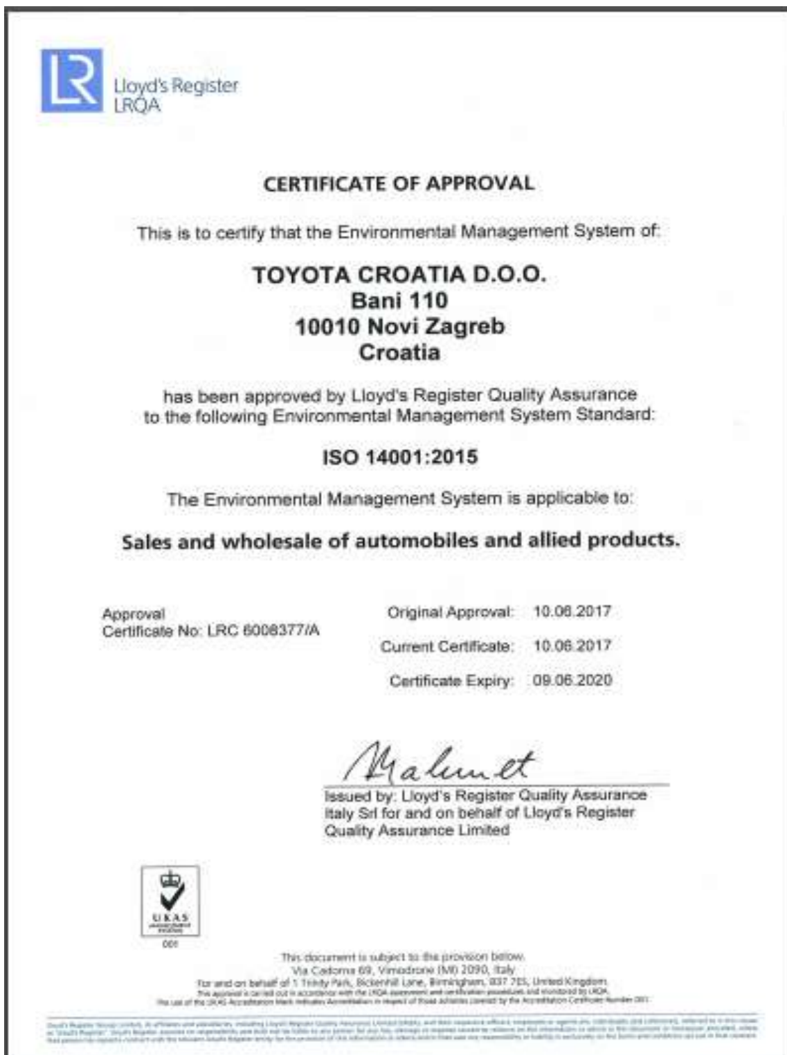
Slika 7. Certifikat ISO 14001:2015 Auto Willa Toyota