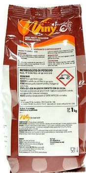
Slika 5. Kalijev metabisulfit (Enartis)

Kalij metabisulfit (K 2 S 2 O 5 ) - kalijev metabisulfit bijeli je prah koji se najviše koristi u enološke svrhe jer pospješuje čišćenje mošta i vina, otapa polifenole, antioksidacijski djeluje na oksidacijske enzime, snižava kiselinu te antiseptički djeluje na neželjene bakterije.