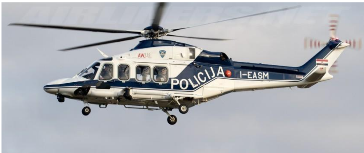
Slika 9. Helikopter AgustaWestland AW139