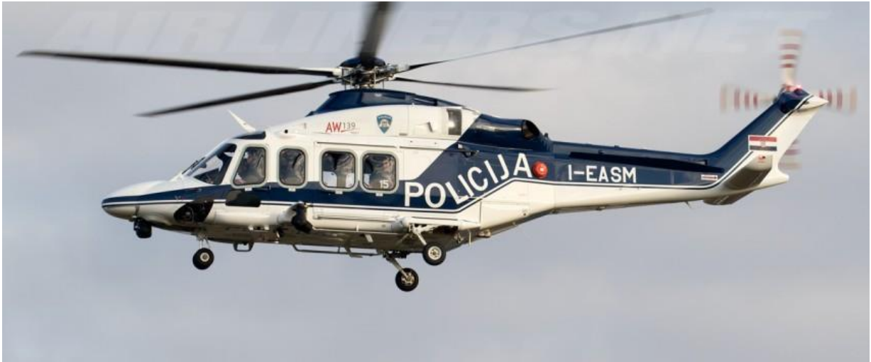
Slika 9. Helikopter AgustaWestland AW139