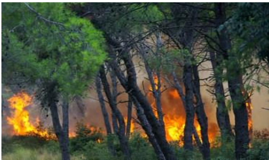
Slika 1. Šumski požar

Najčešće se spominje češer alepskog bora koji prilikom gorenje prenosi požar na udaljenija područja.