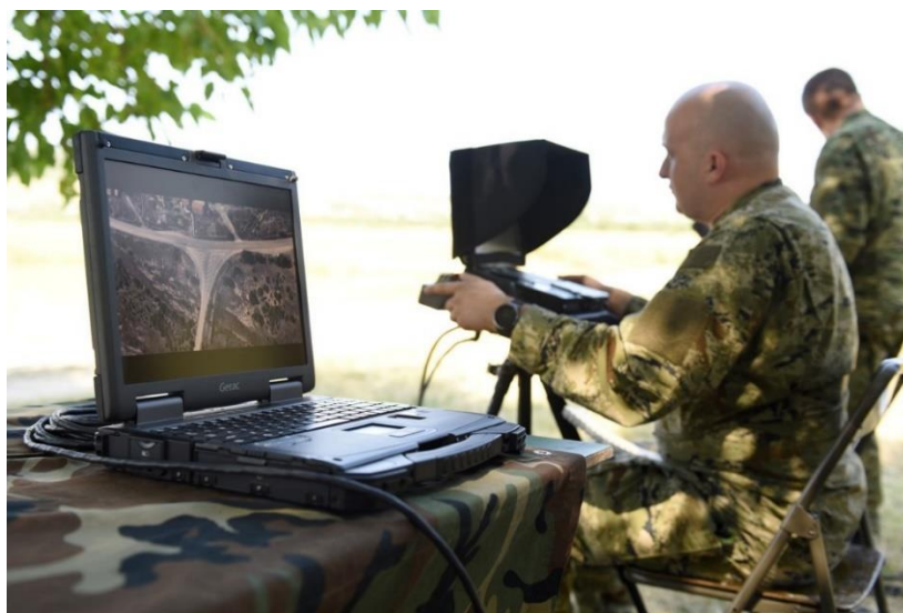
Slika 11. Upravljačka stanica i prikaz terena