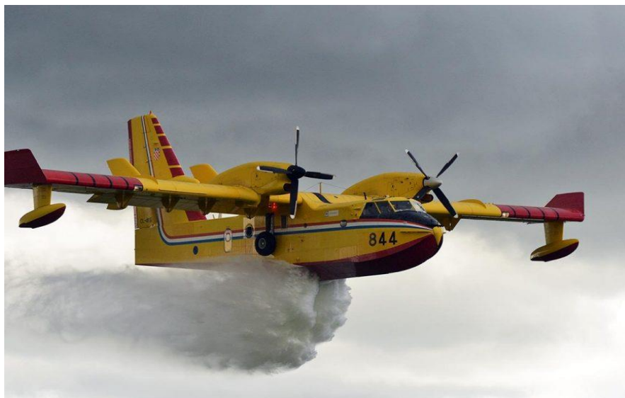
Slika 3. Canadair CL-415