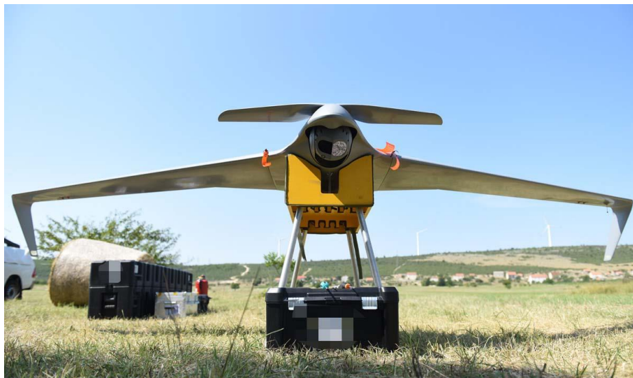
Slika 10. Bespilotna letjelica Orbiter 3B