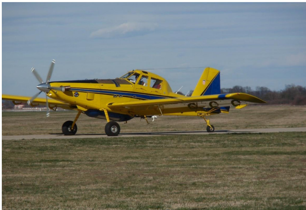
Slika 6. Air Tractor 802 F

Izvor: , https://upload.wikimedia.org/wikipedia/commons/4/48/AT-82_HRZ.JPG 25. 6. 2021.