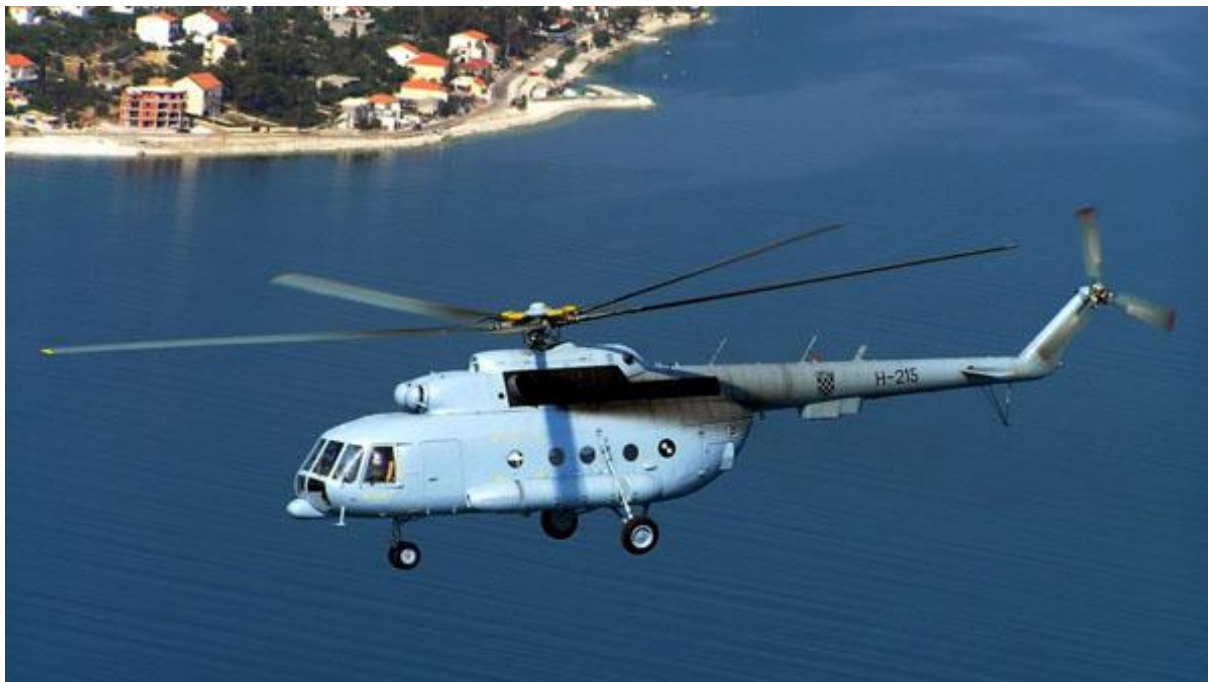
Slika 7. Helikopter Mi-8 MTV 1