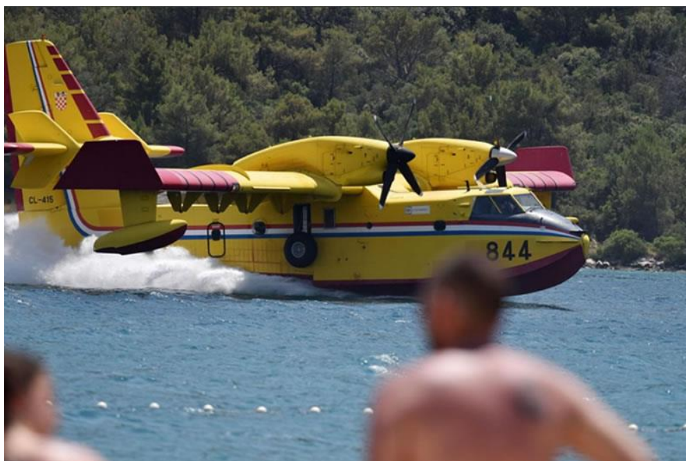
Slika 4. Zrakoplov CL-415 skuplja vodu