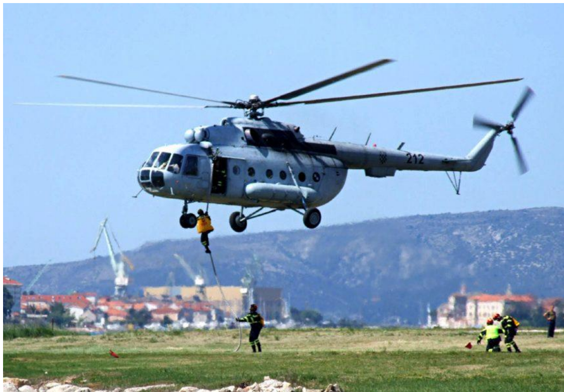
Slika 8. Vježba iskrcavanja vatrogasaca iz Mi-8 MTV 1