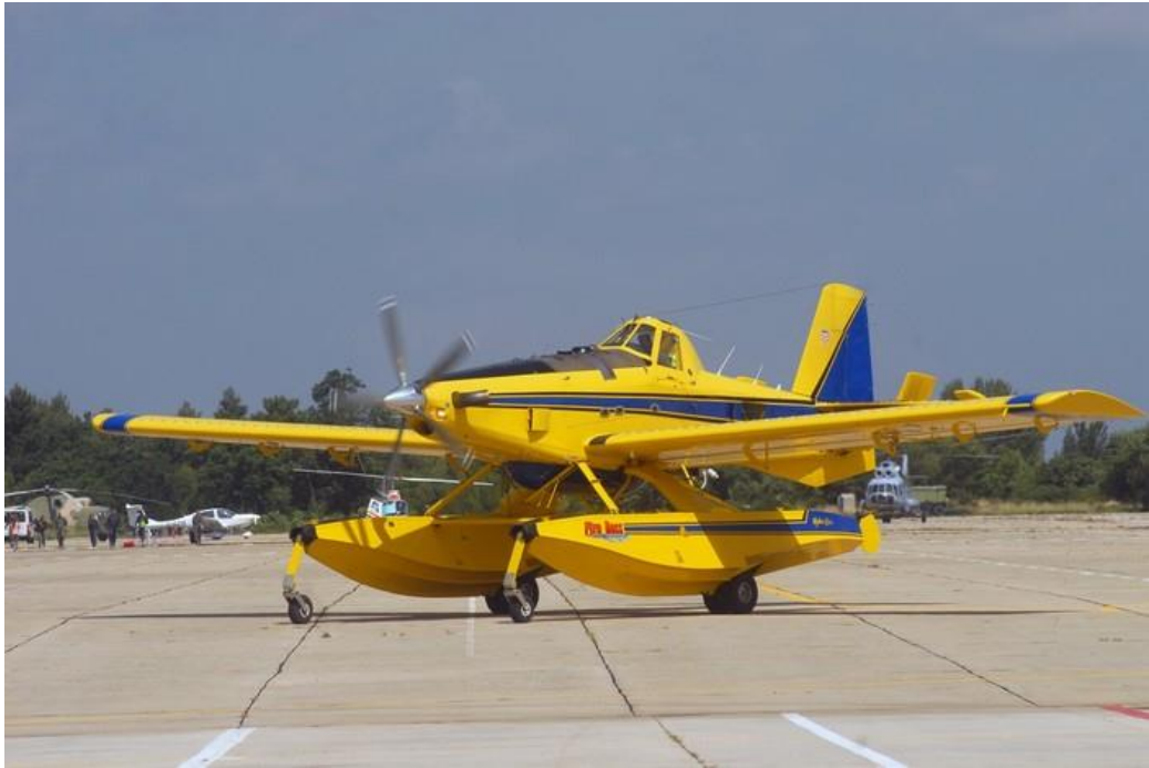
Slika 5. Air Tractor AT-802 A Fire Boss