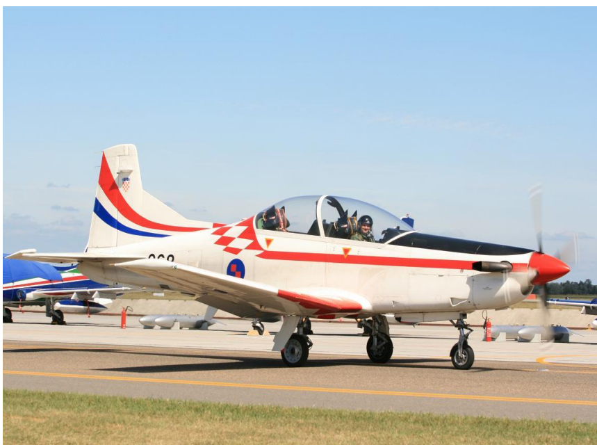
Slika 12. Pilatus PC-9M