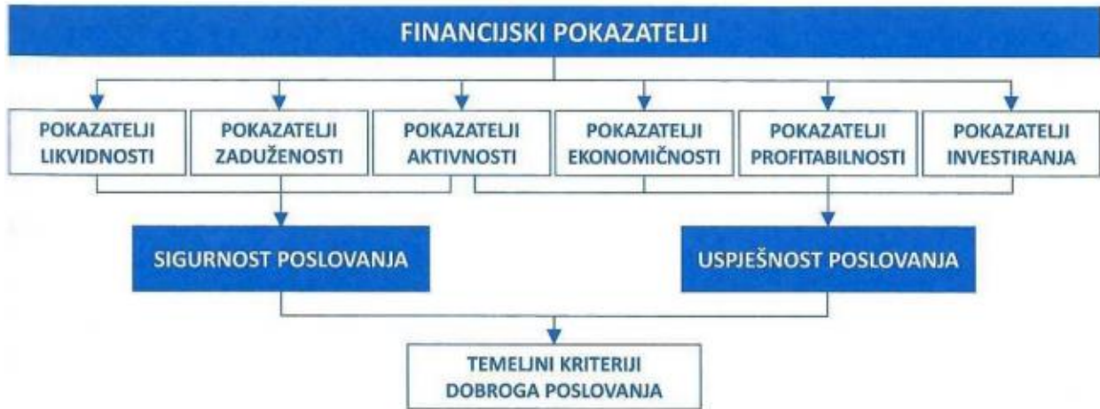
Slika 2.: Temeljne skupine finansijskih pokazatelja i kriteriji dobrog poslovanja