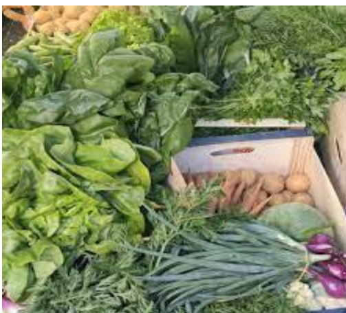
Slika 7: Proizvodi OPG-a Pustaj

Izvor; https://mobile.facebook.com/pustajopg/posts/ (Preuzeto 18.06.2022)