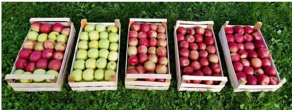
Slika 5: Različite sorte jabuka iz prodaje OPG-a Ružić