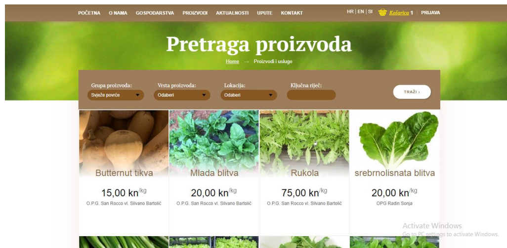
Slika 2: Prikaz tražilice na Web-tržnici