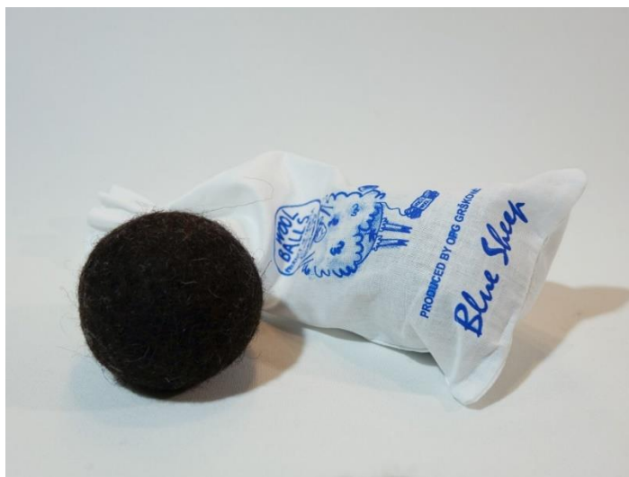
Slika 6: Blue Sheep loptica za sušilicu