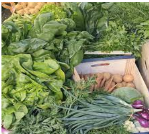
Slika 7: Proizvodi OPG-a Pustaj

Izvor; https://mobile.facebook.com/pustajopg/posts/ (Preuzeto 18.06.2022)