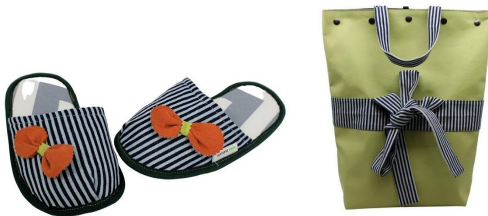
Slika 2 Proizvodi udruge Humana nova

Svoje proizvode rade na način da im građani donose staru odjeću te ostavljaju u spremnicima. Ono što je upotrebljivo, koriste za vlastiti second hand shop, a neupotrebljivi materijal obrade na način da odvoje pamuk te ga ponovno plasiraju na tržište za sektor industrije. Obzirom na to da surađuju sa tvrtkom "Regeneracija Zabok", tekstil koji ostane ide zatim u proces reciklaže. Na taj način, čuvaju okoliš a tekstil koji ostane postaje izuzetna sirovina koji se nadalje izvozi u Europsku uniju. Odjeća i proizvodi iz webshopa, rezultat su 17 vrijednih krojačica iz društveno ugroženih skupina. Sav tekstil i materijali koji se koriste, lokalno su nabavljeni. A osim toga, u uporabi pri njihovoj proizvodnji su naravno i reciklirani materijali. Uz proizvode koje izrađuju, svakako su i izvrsni edukatori. Suraduju sa lokalnim vlastima, udrugama ali i školama kako bi pokazali da razlike među ljudima, ne postoje. Održavaju radionice gdje educiraju mlade o recikliranju tekstila ( https://humananova.org/ , 2022).