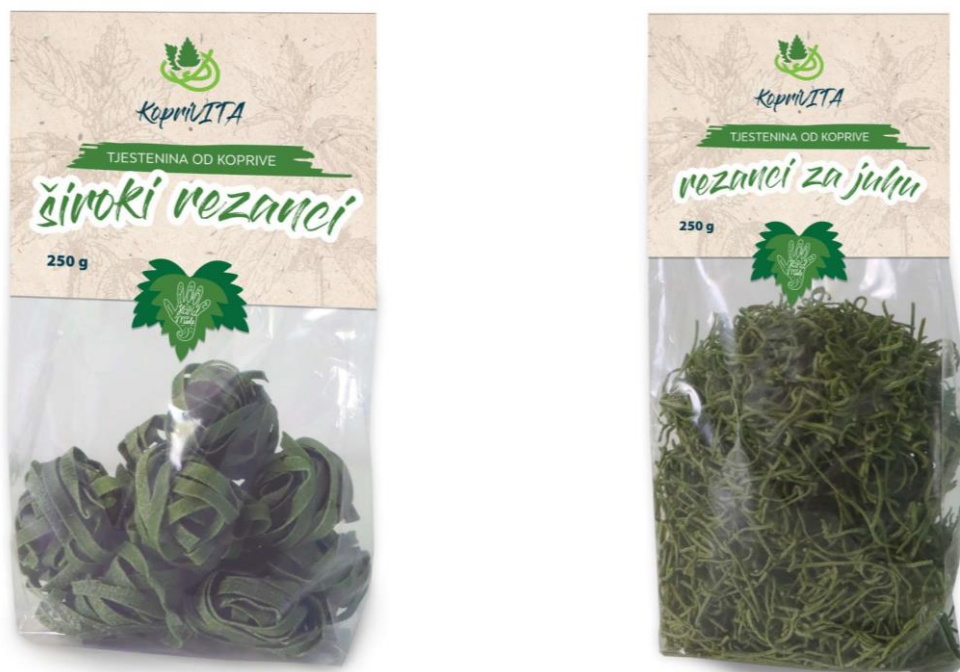
Slika 4 Proizvod udruge KopriVITA