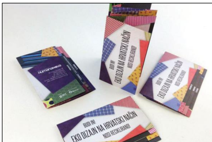
Slika 1 Rad poduzeća osnovanog od strane ACT grupe - ACT printlab