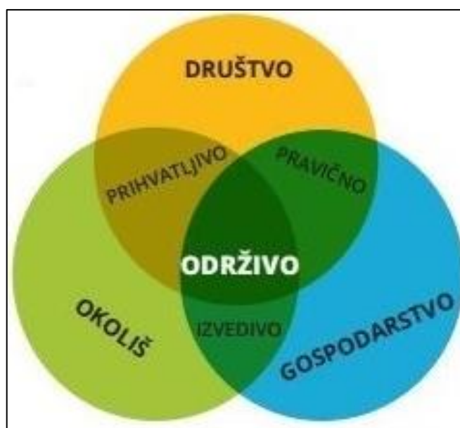
Shema 2 Suodnos održivog razvoja

Održivi razvoj služi za kreiranje strategije neprekidnog socijalnog i gospodarskog napretka. U navedenom terminu, ne radi šteta za okoliš niti za izvore prirodnog porijekla, bitne za djelatnosti u budućnosti. Održivi razvoj vrlo je važan u poslovanju. Upravo zato što objedinjuje tri važna razvojna načela: tehnološki napredak, zaštitu okoliša i sudjelovanje građana u odlučivanju (Pavić-Rogošić, 2020).