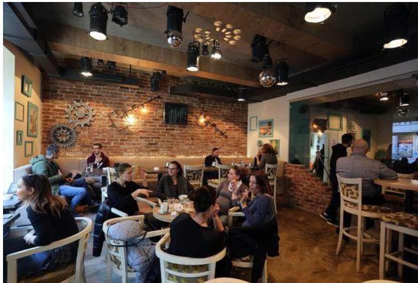
Slika 3 Interijer kafića - Znak tišine