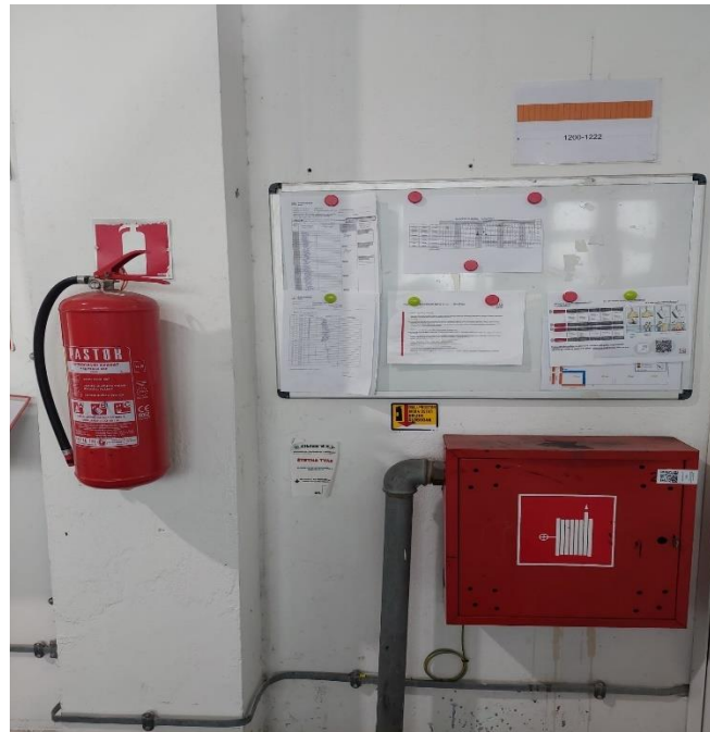
Slika 10: Vatrogasni aparat i unutrašnji hidrant