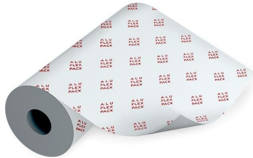
Slika 3: Aluminijska folija