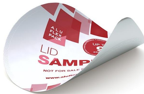
Slika 4: Aluminijski poklopac