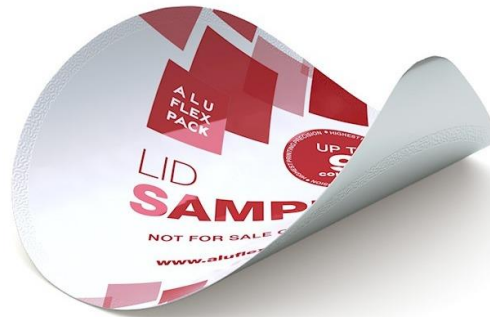
Slika 4: Aluminijski poklopac