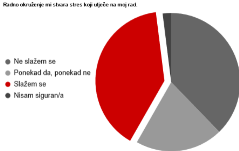
Grafikon 2: Utjecaj stresa na rad zaposlenika