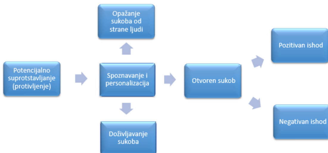
Slika 1. Faze procesa sukoba

Izvor: Sikavica P, Novak M. (1999.) Poslovna Organizacija: Treće, izmijenjeno i dopunjeno izdanje, Zagreb: Informator; str 640