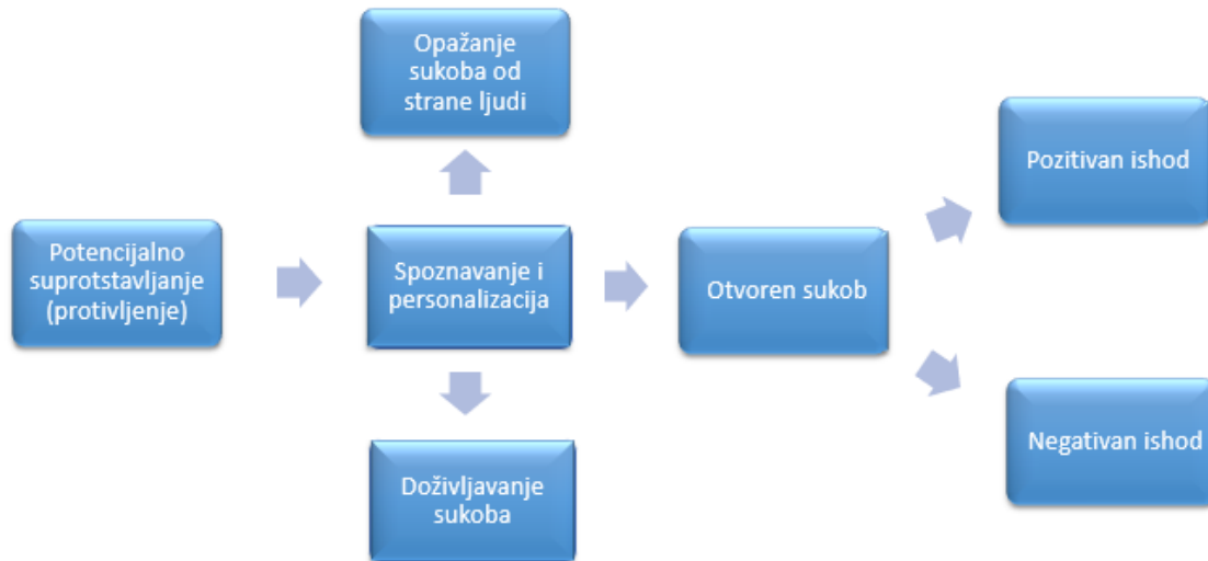
Slika 1. Faze procesa sukoba

Izvor: Sikavica P, Novak M. (1999.) Poslovna Organizacija: Treće, izmijenjeno i dopunjeno izdanje, Zagreb: Informator; str 640