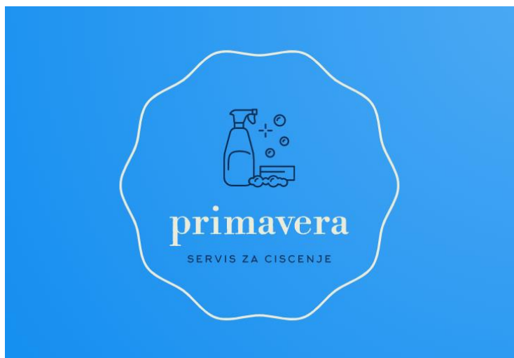
Slika 2: Logo poduzeća

Proizvod, odnosno usluga, koju nudi obrt „Primavera“ je čišćenje ili održavanje kuća za odmor, apartmana i poslovnih prostora. S obzirom da se u slučaju ovog obrta radi o usluzi, a ne o proizvodu, uložila su se sredstva u razvoj prepoznatljivog loga.