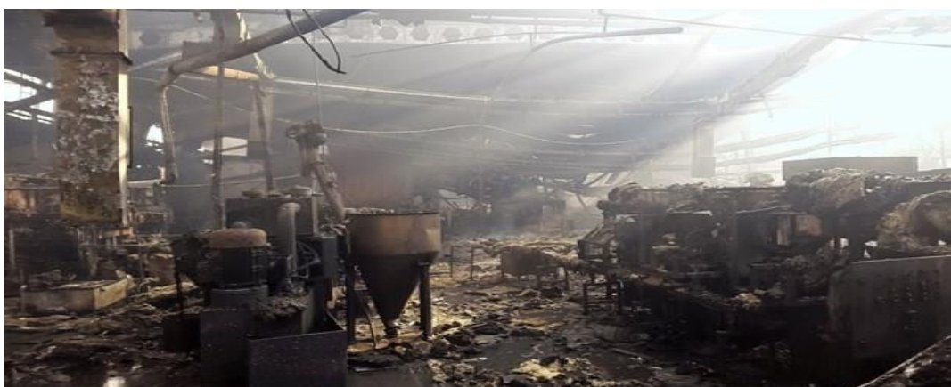
Slika 10: Unutrašnjost tvornice nakon požara