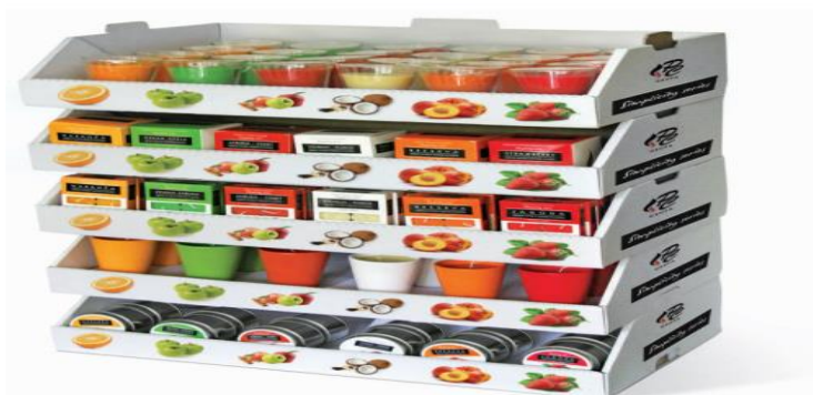
Slika 4: Mirisne svijeće