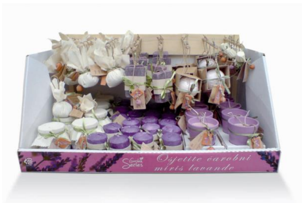
Slika 5: Mirisni asortiman PC grupe