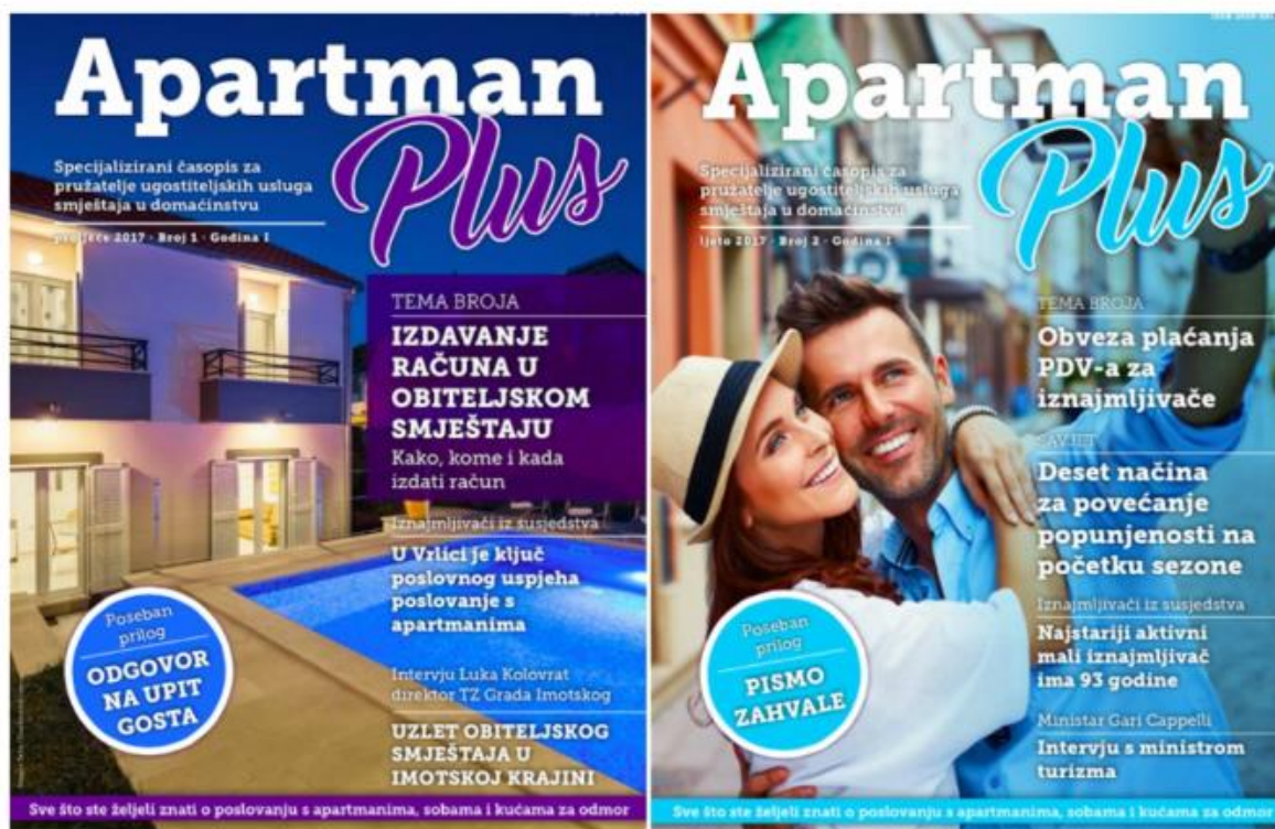
Slika 13: Časopis Apartman Plus