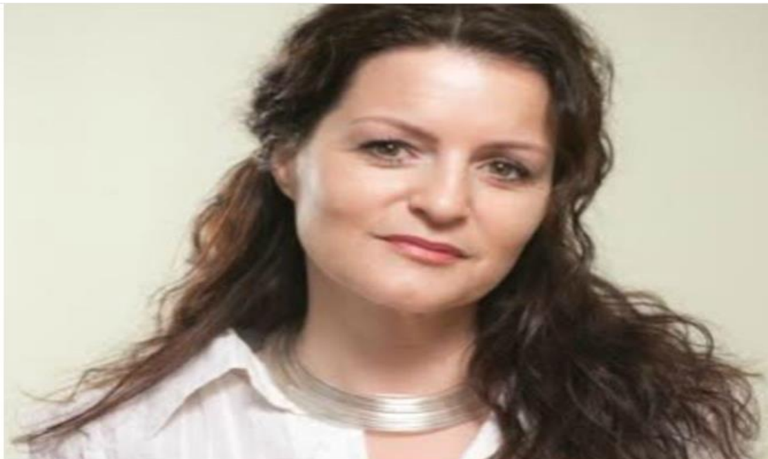
Slika 12: Uspješna mikropoduzetnica 2017. godine