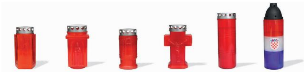
Slika 3: Nadgrobni lampioni