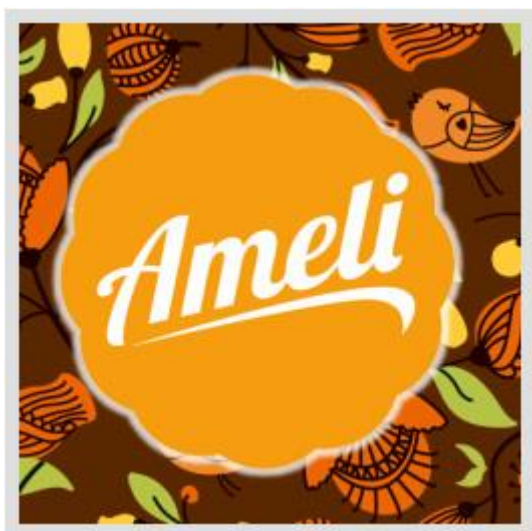
Slika 7: Ameli-zaštitni znak PC Grupe d.o.o.