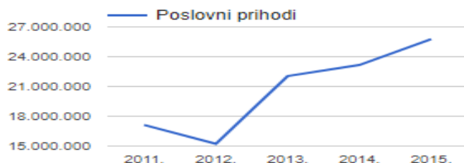
Slika 8 : Poslovni prihodi PC Grupe