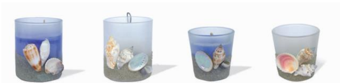
Slika 6: Morske svijeće