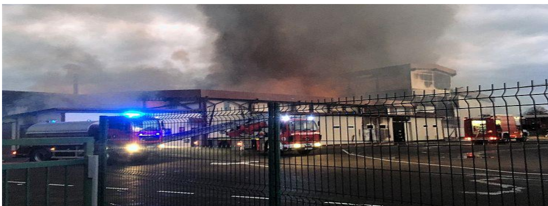
Slika 9: Požar tvornice PC Grupa