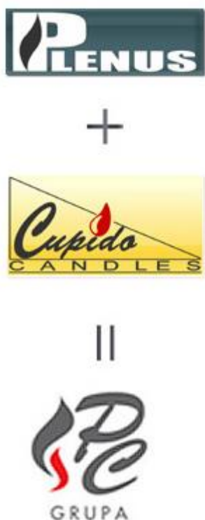
Slika 2: Logo PC Grupe