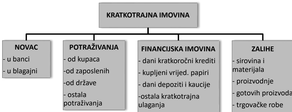
Slika 1. Oblici kratkotrajne imovine

Izvor: Žager, K., Žager, L., Analiza financijskih izvještaja, Masmedia, Zagreb, 1999., 36.