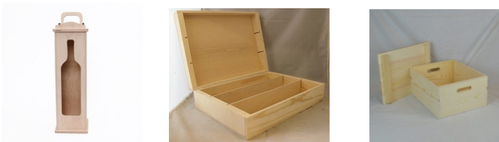
Slika 8. Primjer izgleda kutija za vino

Izvor: http://www.pavin.hr/proizvod/kartonske-kutije-boce (05.06.2018.)