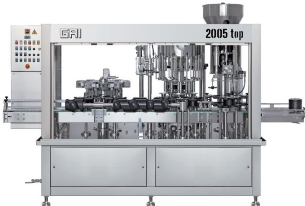
Slika 3. Monoblok za automatsko punjenje - čepljenje