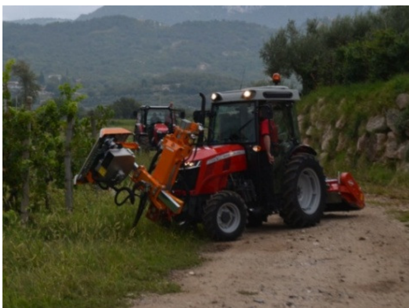
Slika 2. Specijalizirani traktor za vinograde i voćnjake