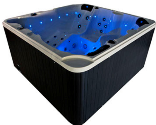
Slika 4. Hidromasažna kada i sauna

Osim masaža gostima aparthotela na raspolaganju će u istom prostoru biti hidromasažna kada i sauna.