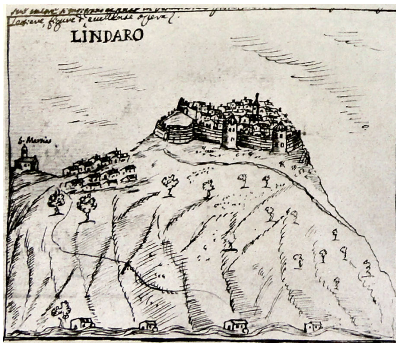
Slika 1. Prospero Petronio, Lindar, grafika, 1681.god.