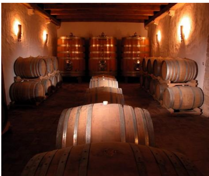
Slika 9. Podrum s drvenim bačvama