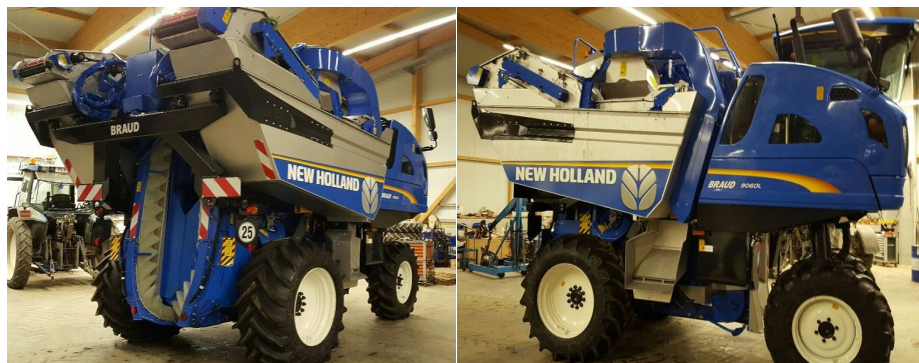
Slika 10. Stroj za berbu grožđa