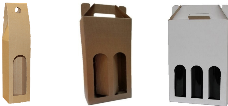
Slika 7. Primjer kartonske ambalaže