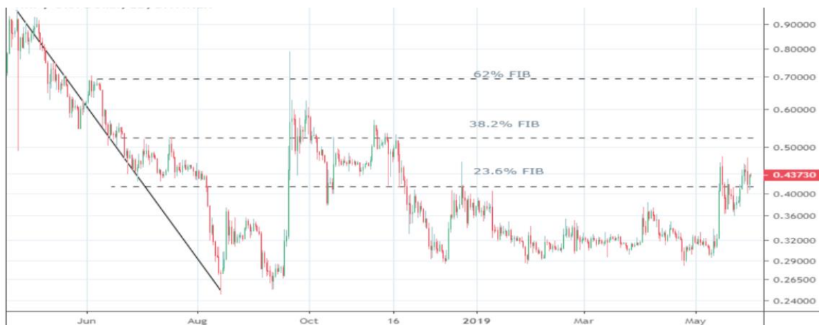
Grafikon 9: Analiza kretanja cijene Ripplea

Ripple kao jedna od alternativa bitcoinu, ima svoj određen broj investitora, ponajviše jer je riječ o kriptovaluti koja je jeftina i uvijek će biti investitora koji su spremni ulagati u Ripple. Kao i Ethereum, ova kripto valuta predstavlja alternativu za investitore koji nemaju dovoljno novaca za bitcoin, te i Ripple prati trend kretanja bitcoina.