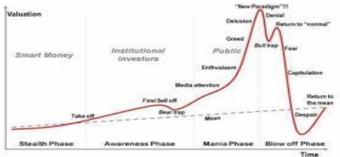
Slika 1 : Primjer investicijskog balona

dionica temeljena na velikoj vrijednosti bez osnova dovodi do pucanja balona i nastaje početak krize.