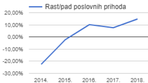
Grafikon 3 - rast i pad poslovnih prihoda tvrtke Gavrilović u razdoblju od 2014. do 2018.g.