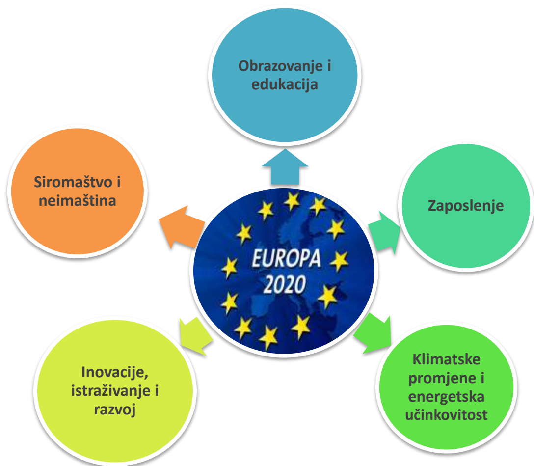
Grafikon 1. Ciljevi strategije Europa 2020