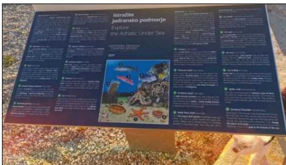
Slika 8. Informativna tabla Jadranskog podmorja kampa Lanterne

Uz sve navedene ekološke pozitivne strane kampa Lanterne, kamp posjeduje i mjesto za odlaganje prljave vode iz kampera, dakle zagađena i prljava voda se ne ispušta u more. Plaže kampa Lanterne su redovno održavane stoga posjeduju i nagradu Plava zastava za svoju čistoću mora. Na morskom dnu se mogu pronaći razne zaštićene školjke te morske životinje stoga je u kampu zabranjen izlov ribe i morskih organizama. Kako bi kamp osvjestio svoje djelatnike ali i goste o zaštićenim morskim vrstama, na nekoliko lokacija mogu se pronaći informativne tabele o zaštićenim morskim životinjama kampa.