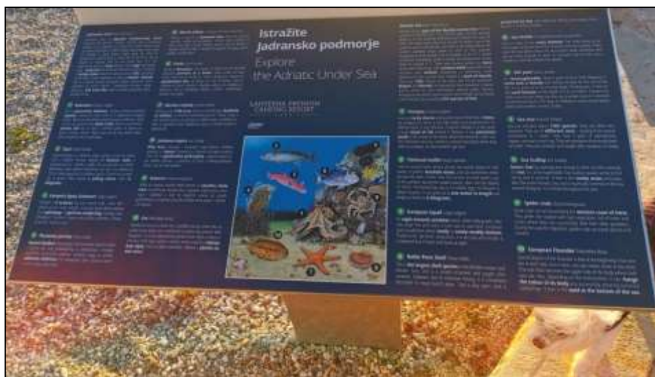
Slika 8. Informativna tabla Jadranskog podmorja kampa Lanterne

Uz sve navedene ekološke pozitivne strane kampa Lanterne, kamp posjeduje i mjesto za odlaganje prljave vode iz kampera, dakle zagađena i prljava voda se ne ispušta u more. Plaže kampa Lanterne su redovno održavane stoga posjeduju i nagradu Plava zastava za svoju čistoću mora. Na morskom dnu se mogu pronaći razne zaštićene školjke te morske životinje stoga je u kampu zabranjen izlov ribe i morskih organizama. Kako bi kamp osvjestio svoje djelatnike ali i goste o zaštićenim morskim vrstama, na nekoliko lokacija mogu se pronaći informativne tabele o zaštićenim morskim životinjama kampa.