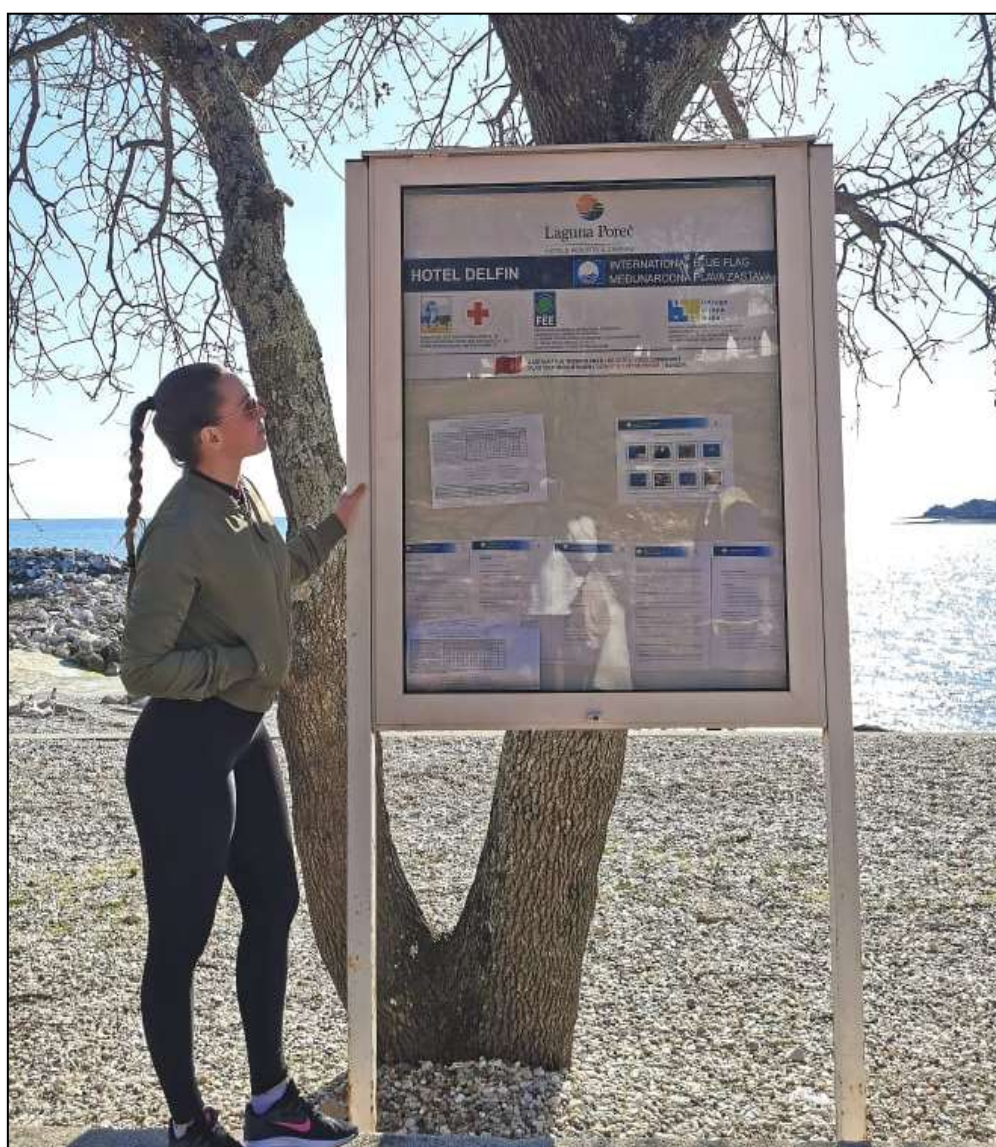
Slika 2. Informativna tabla plaže Delfin, sezona 2019.

međunarodnog i nacionalnog koordinatora, podatke o naznačenoj plaži, kao što su: zašto je plaža nagrađivana, ekološki kodeks, europska plava zastava, primjeri aktivnosti odgoja i obrazovanja o okolišu, zaštićena priroda, analitička izvješća uzrokovanja mora za određenu sezonsku godinu, europska plava zastava i sl.