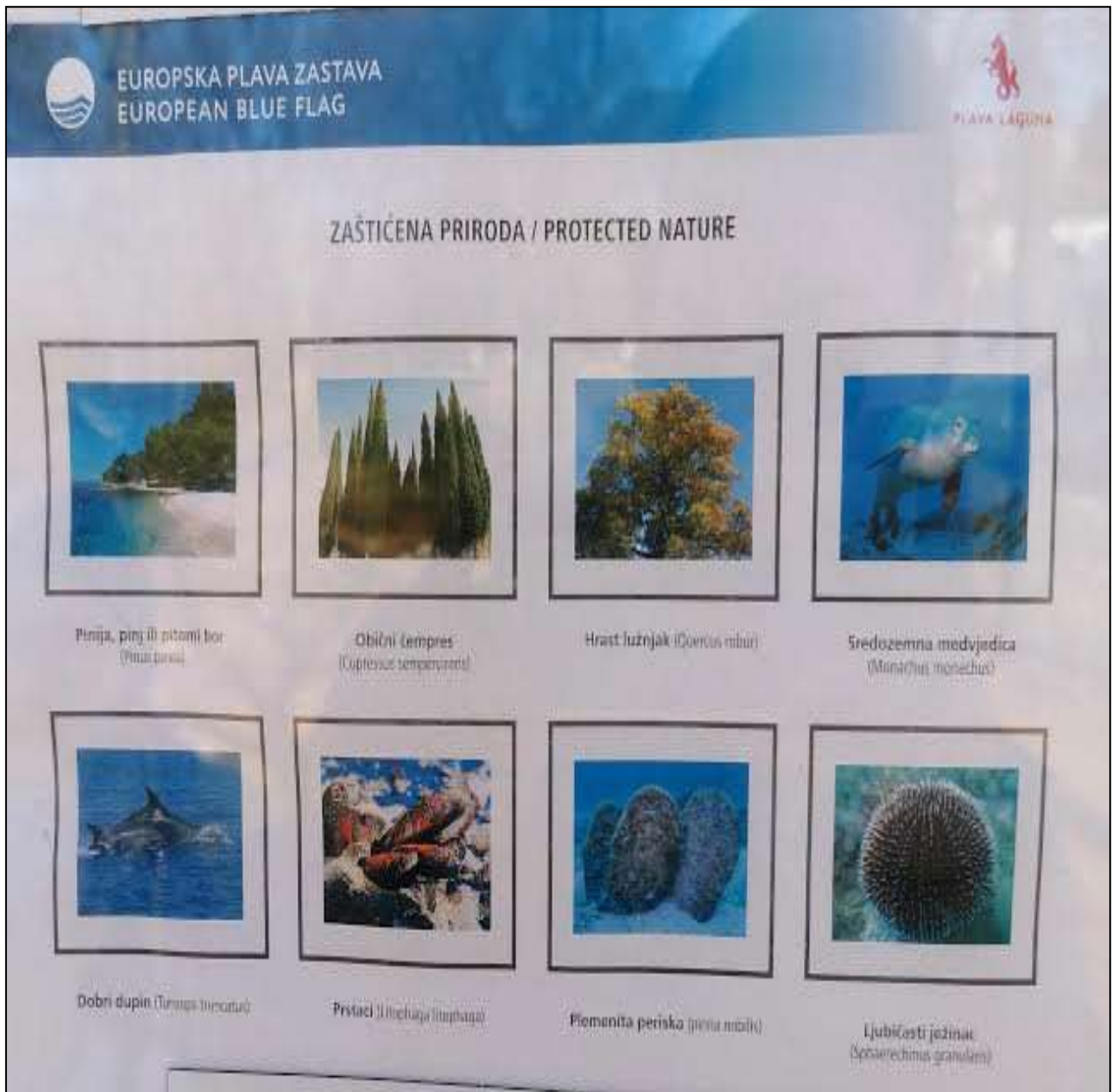
(plaža Laguna Materada, Poreč)