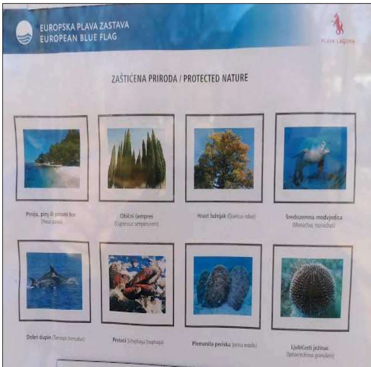
Izvor: Obrada autora (plaža Laguna Materada, Poreč)