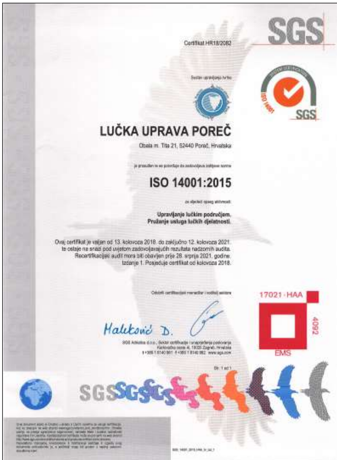
Slika 6. Certifikat ISO 14001:2015 lučke uprave Poreč