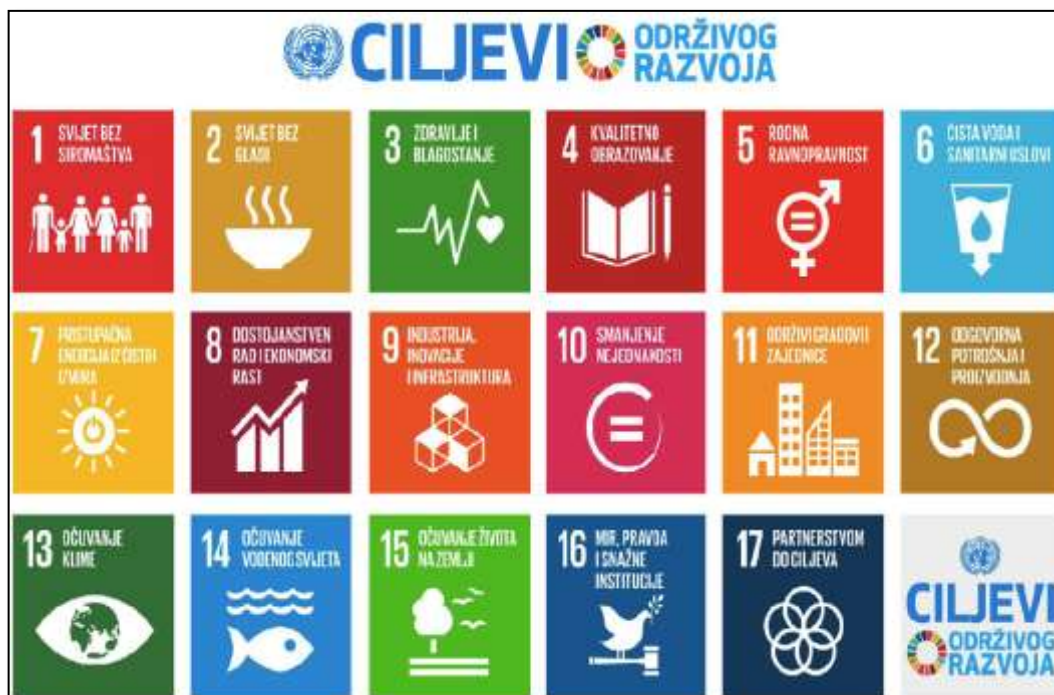
Slika 1. Ciljevi održivog razvoja

Jedna od pet osoba u regijama u razvoju i dalje živi s manje od 1,25 USD dnevno. Iako se ekstremna stopa siromaštva smanjila za više od polovice od 1990. godine, cilj je sve do kraja 2030. iskorijeniti ekstremno siromaštvo. Cilj nije samo ukidanje siromaštva nego ujedno omogućiti i financijsku slobodu. Potrebno je osigurati značajnu mobilizaciju resursa iz različitih izvora, te kreirati jasne javne politike na nacionalnoj, regionalnoj i međunarodnoj razini koje se temeljene na razvojnim strategijama koje promoviraju borbu protiv siromaštva i rodnu osjetljivost.