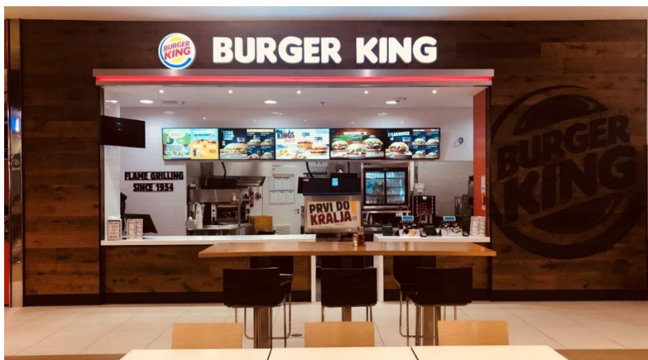
Slika 2: Burger King Split