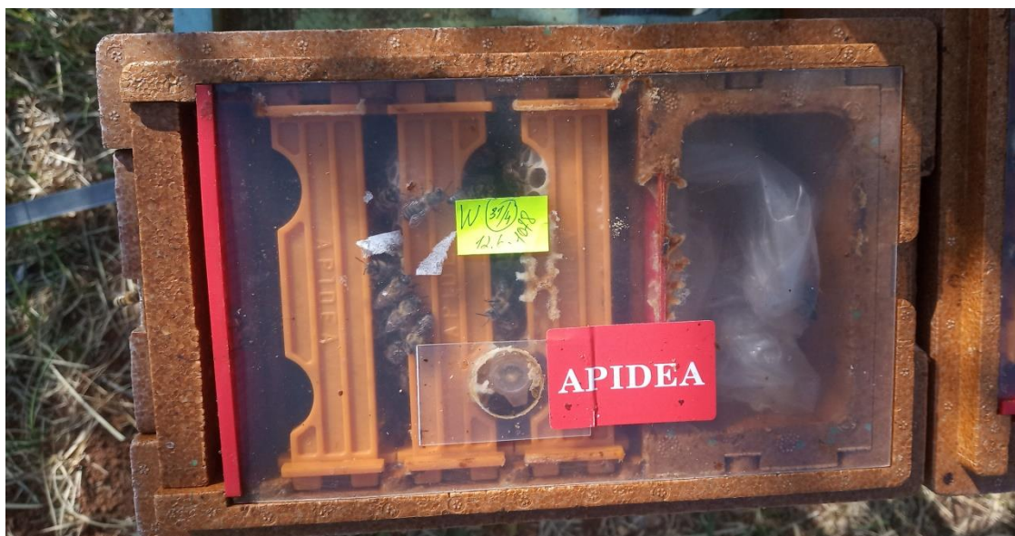
Slika 2. Oplodnjak „Apidea“

Oplodnjaci se razlikuju po svojoj veličini, konstrukciji, postotku učinkovitosti odnosno oplodnje i ekonomskoj isplativosti. Izrađeni od drva ili umjetnih materijala poput poliuretana, dolaze u raznim veličinama. Postoje mini oplodnjaci kod kojih je potrebno do 350 pčela za punjenje. Nedostatak je mali prostor koji ne zadovoljava, stoga se pojavljuje napuštanje oplodnjaka od strane pčela. Druga vrsta oplodnjaka su mini oplodnjaci s tri mini okvira, poput oplodnjaka tipa „Apidea“ (Slika 2.) korištenog u ovom istraživanju. Postotak oplodnje matice u ovakvim oplodnjacima je 85%. U jednom punjenju stane do 1000 pčela. Takvi oplodnjaci su skuplji ali isplativiji već u prvoj godini proizvodnje.