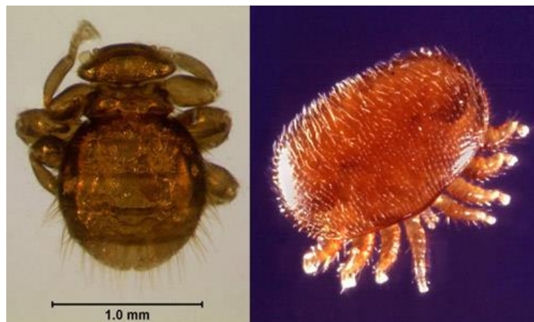
Slika 3: Pčelinja uš i grinja varroa