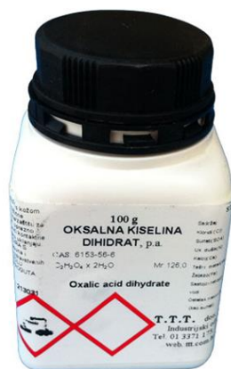
Slika 7: Oksalna kiselina