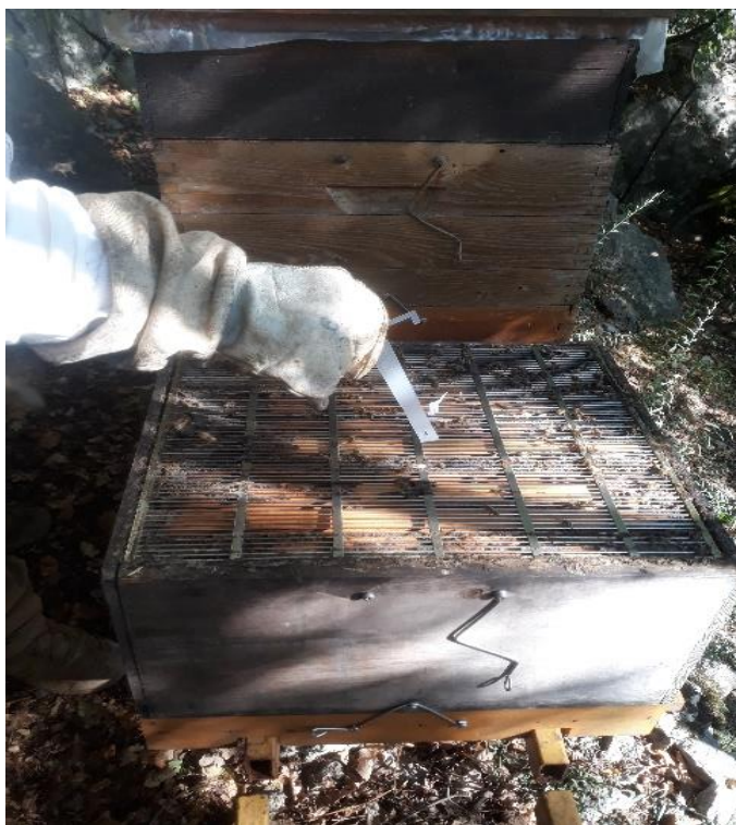
Ivor 16:

Treće sredstvo koje smo koristili je otopljena organska kiselina. Ovaj lijek je u obliku kartonskih traka impregniranih otopljenom oksalnom kiselinom. Njome smo tretirali 9 košnica od kojih su dvije za kontrolu. Koriste ga neki pčelari na otoku Cresu kao međutretman, ali se može koristiti i u ljetnom tretmanu. Upotrebljavali smo dvije trakice po košnici. Invadiranoost prije tretmana je iznosila 1,06%.