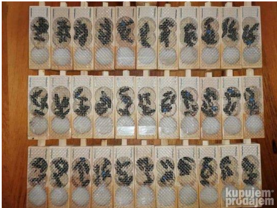
Slika 19: Selekcionirane matice u kavezima s pčelama