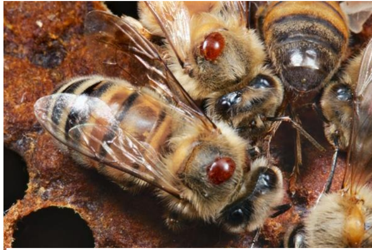
Slika 2: Ženka varroe na pčeli