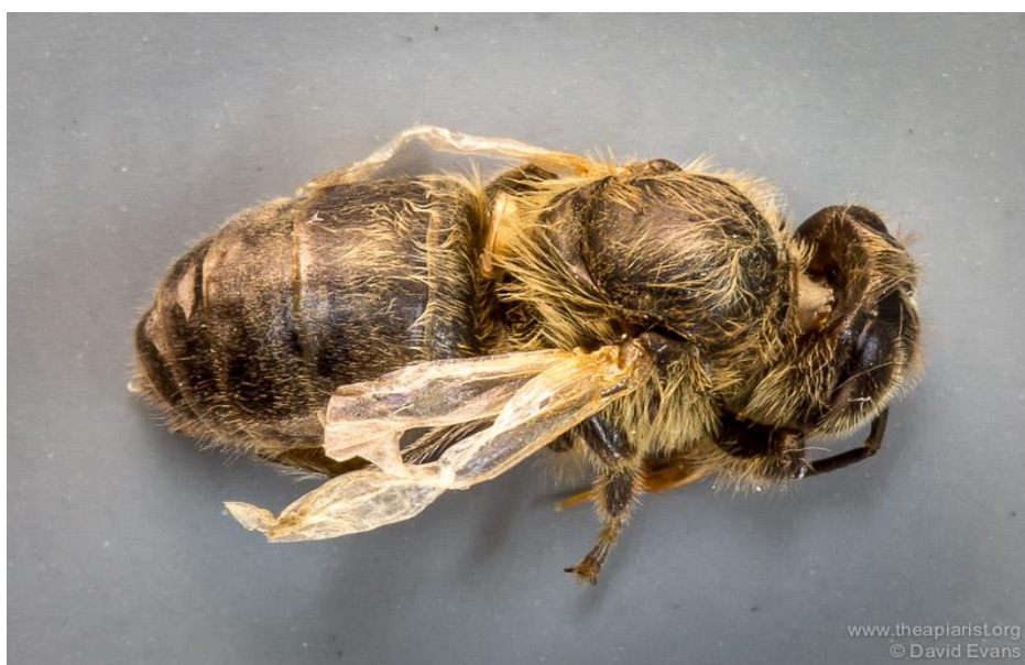
Slika 5: Pčela s nerazvijenim krilima