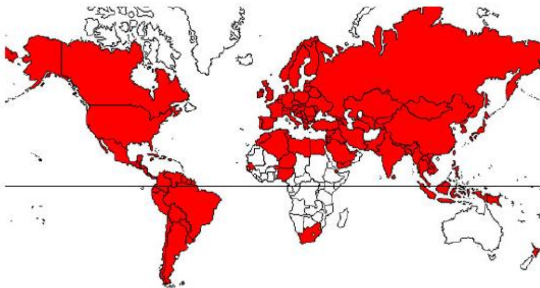
Slika 1: Rasprostranjenost Varroa destructor