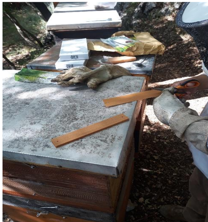
Izvor 17: Vlastita fotografija