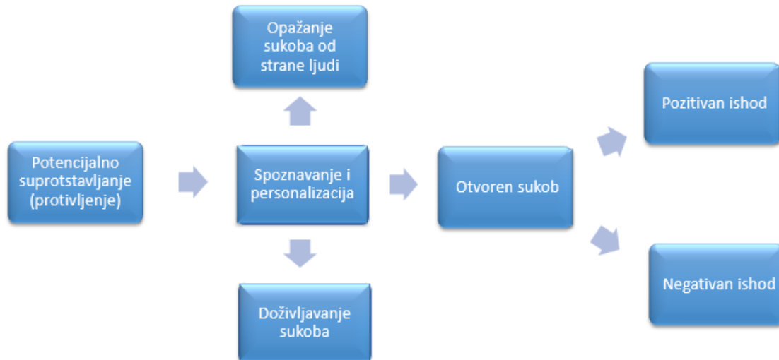
Slika 1. Faze procesa sukoba