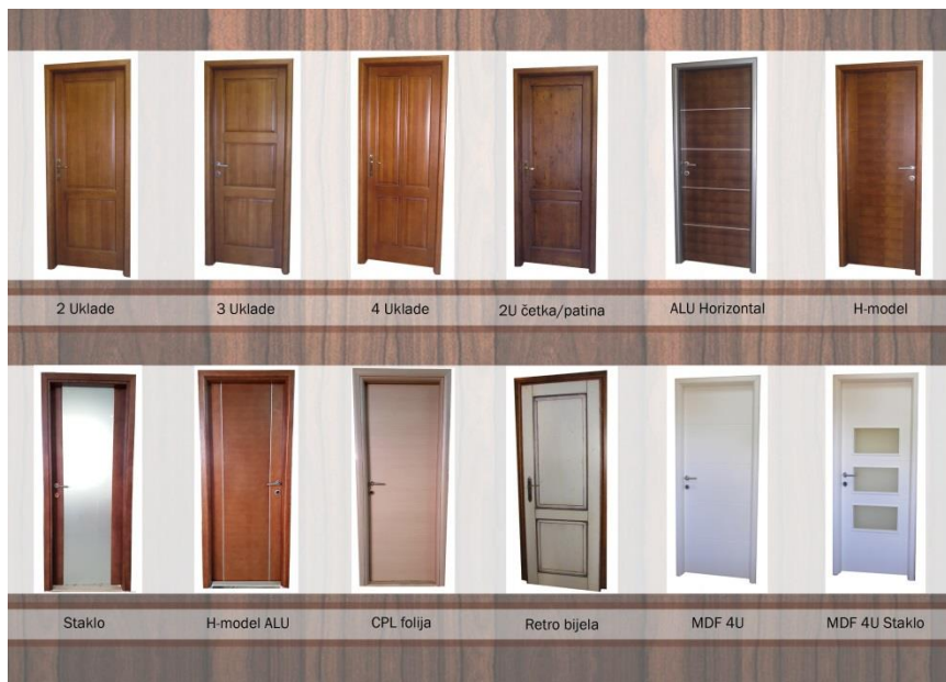
Izrada: Obrada dizajnerice, Larisa Pernić

Letak obrta na prednjoj strani sadrži osnovne kontakt informacije i web stranice kao i vizitka te saunu koju je obrt izradio za klijenta. Stražnja strana također sadrži 2 saune koje je obrt izradio te unutrašnjost jedne saune i 2 modela ležaljka. U unutrašnjem dijelu letka nalaze se modeli vrata koje obrt proizvodi te njihov naziv.