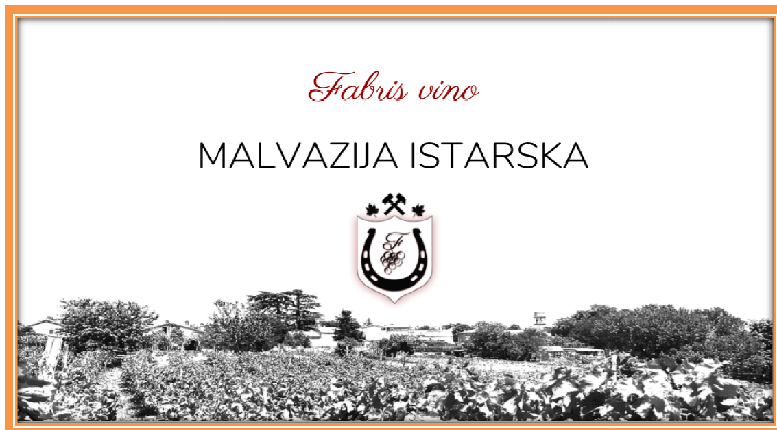
Slika 5. Primjer etikete na buteljnama društva Fabris vino d.o.o.