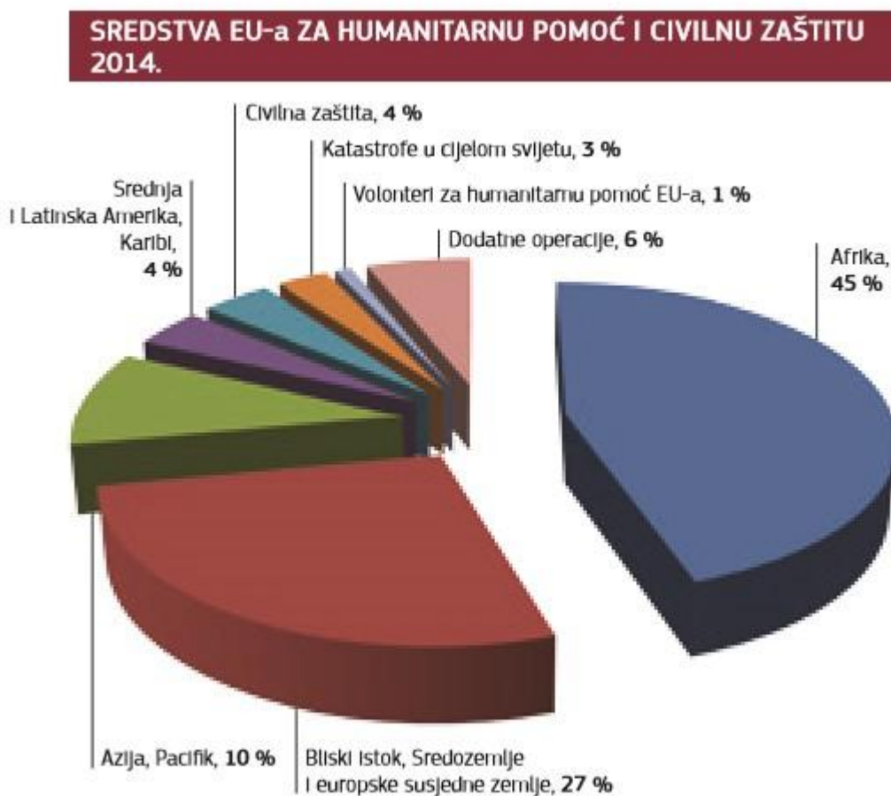
Slika 2. Godišnji prikaz sredstava EU-a za humanitarnu pomoć i civilnu zaštitu za 2014. godinu