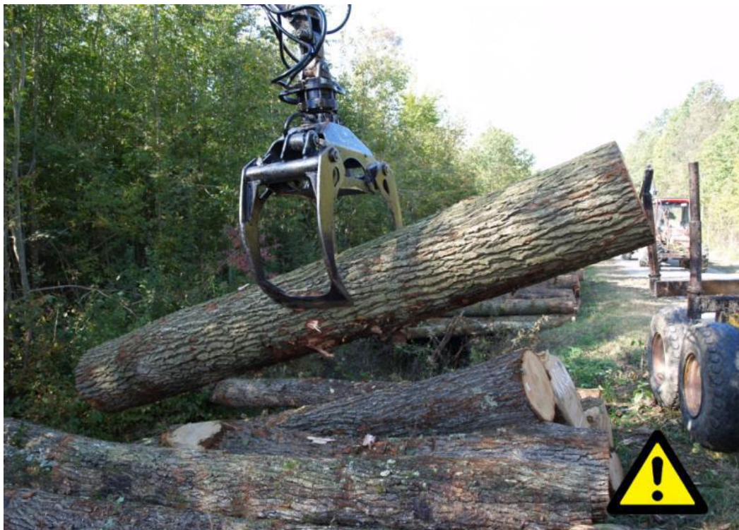
Slika 5. Neispravno obuhvaćen trupac