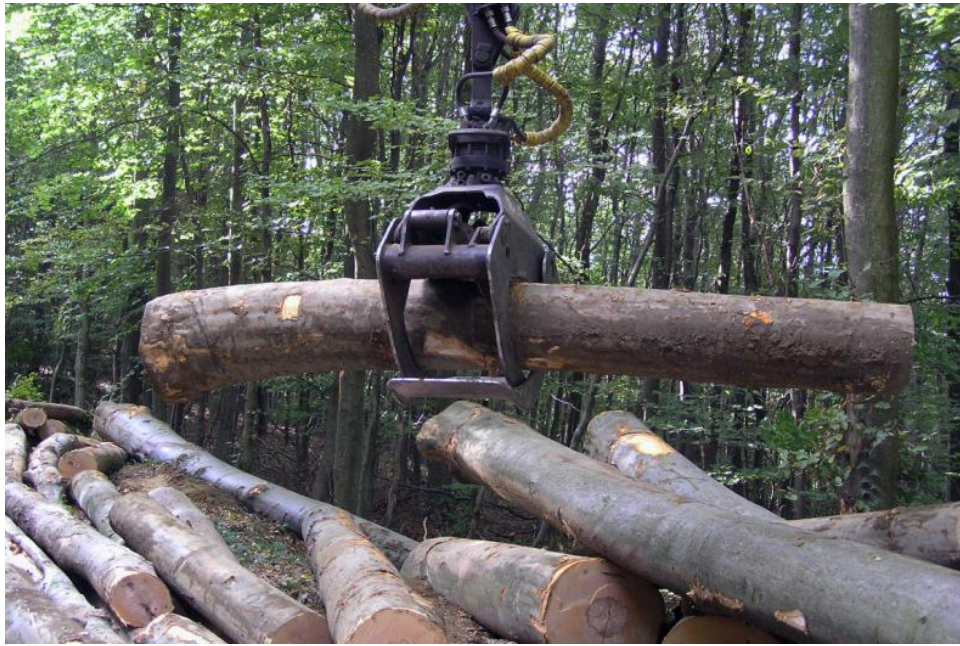
Slika 4. Ispravno obuhvaćen trupac