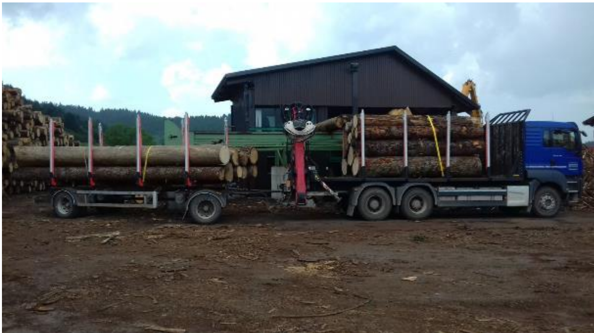
Slika 8. Dizalica u transportnom položaju

Složena roba mora odgovarati propisima u javnom prijevozu. Po završetku utovara treba pregledati dizalicu, prvenstveno spojeve cijevi i priključke. Stabilizatori trebaju biti podignuti i stavljani u položaj za transport, a hidraulična pumpa isključena. Ruka dizalice mora biti sklopljena u transportni položaj, a kliješta moraju pri vožnji biti tako učvršćena da se ne mogu osloboditi.