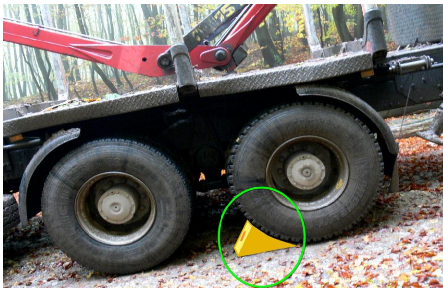
Slika 3. Osiguranje vozila

Na nizbrdici prije utovara ili istovara vozilo treba zakočiti i pod kotače postaviti klinastu podlošku.