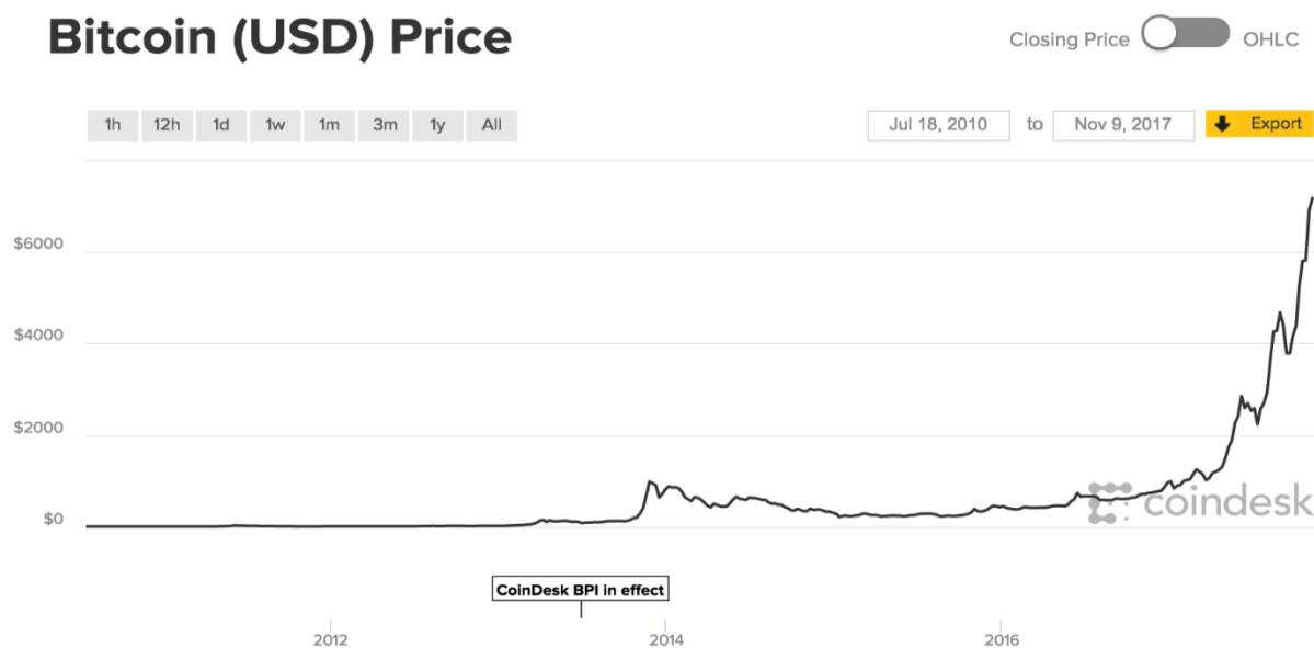
Grafikon 5: Cijena kretanja bitcoina