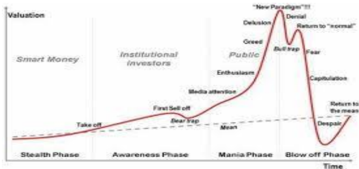
Slika 1 : Primjer investicijskog balona

dionica temeljena na velikoj vrijednosti bez osnova dovodi do pucanja balona i nastaje početak krize.