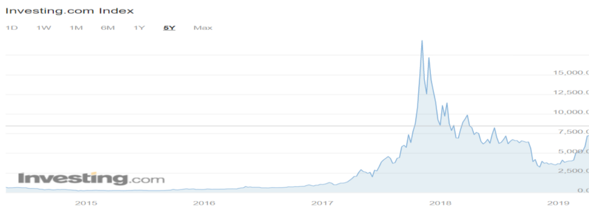
Grafikon 1: Cijena kretanja Bitcoina posljednjih pet godina

Bitcoinom se trguje na raznim svjetskim burzama te platformama. Oznaka za trgovanje na burzi je BTC. Cijena Bitcoina sklona je promjenama u kratkom vremenskom periodu te se zaključuje na dnevnoj bazi gdje se određuje njezina cijena. Nakon osnutka Bitcoina, cijena jednog Bitcoina iznosila je 0.003 USD, dok je najveća cijena izosila 19.345 USD. Cijena na dan 26.05.2019 iznosi 8.017 USD. Maksimalna količina bitcoina iznosi 21 milijun, uz maksimalan volumen vrijednosti od 24 milrd. USD u zadnjih 24 sata. Grafikonom 1, prikazana je cijena trgovanja bitcoinom u posljednjih pet godina.