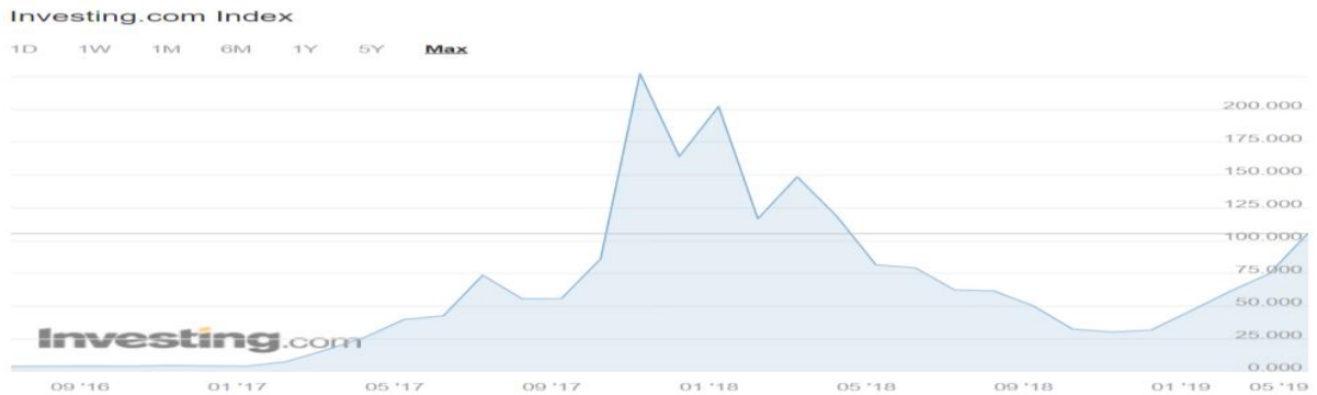
Grafikon 4: Cijena kretanja Litecoina od osnutka