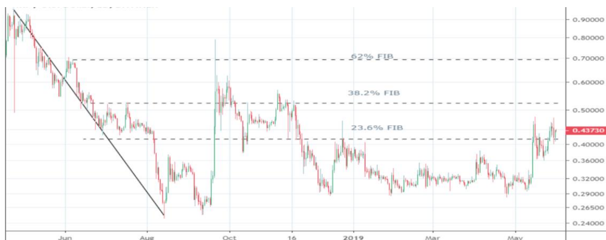
Grafikon 9: Analiza kretanja cijene Ripplea

Ripple kao jedna od alternativa bitcoinu, ima svoj određen broj investitora, ponajviše jer je riječ o kriptovaluti koja je jeftina i uvijek će biti investitora koji su spremni ulagati u Ripple. Kao i Ethereum, ova kripto valuta predstavlja alternativu za investitore koji nemaju dovoljno novaca za bitcoin, te i Ripple prati trend kretanja bitcoina.