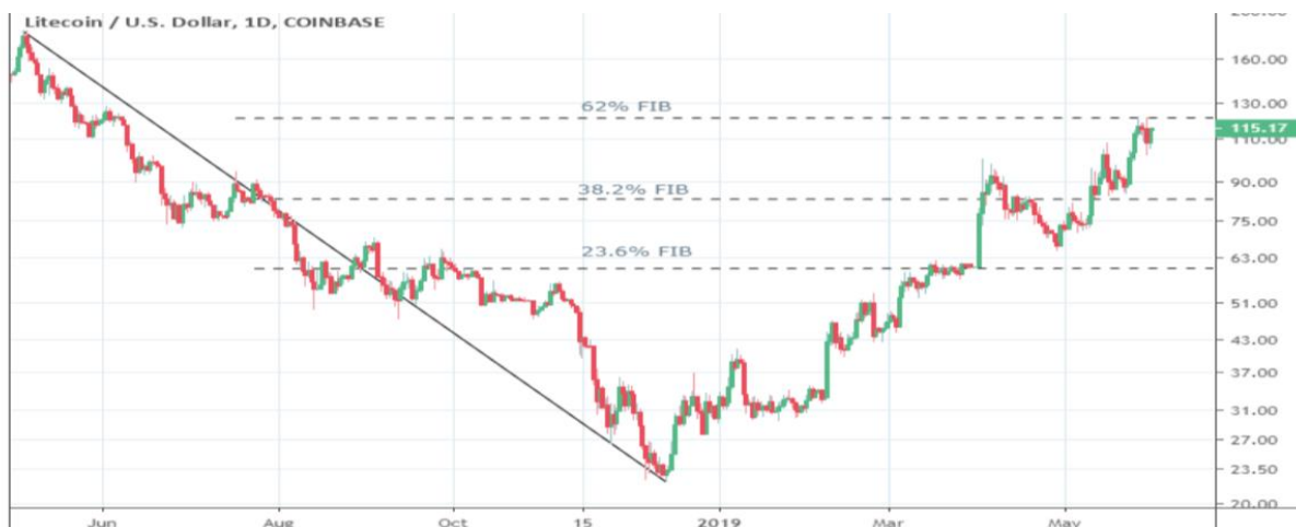
Grafikon 10: Analiza kretanja cijene Litecoina s razinama otpora i potpore

Litecoin kao još jedna alternativa, pokazuje da tržište kriptovalutama ima prostora. Povijesno gledano također prati cijenu bitcoina, i po rastu i po padu.