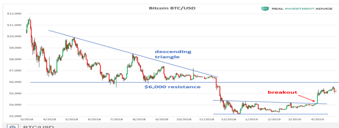
Grafikon 7: Analiza kretanja bitcoina u periodu od svibnja 2018. do travnja 2019. godine

Na prvom grafu to bi svrstali u razdoblje euforije, kada su mnogi kripto “gurui” predviđali rast na preko 100.000 USD do kraja godine. Kako takav rast nije prirodan i dugoročno održiv, s objavom prvih bitcoin futuresa 16. prosinca 2017. godine dolazi do prvog većeg pada na oko 12.000 dolara, mnogi su u to razdoblje iskoristili za kupnju “jeftinih” bitcoina u nadi da će cijena nastaviti rasti do kraja godine, što je i bio slučaj, ali samo do 17.000 USD. Kada je dotaknut vrh, nedostajalo je novih investitora te je broj medijskih članaka o bitcoinu znatno pao, što je vidljivo iz Google trendova. Kroz cijeli siječanj i dio veljače u 2018. godini bitcoin bilježi pad do 6.000 USD, što su uzrokovale većinom loše vijesti iz Azije o zabrani korištenja kriptovaluta u nekim državama, zatim zabrana ICO-a u Kini te snažne poruke o regulaciji kripto burzi i tržišta u Japanu i Južnoj Koreji. No to ne znači da su kriptovalute zabranjene, niti će tako skoro biti, nego samo da će svaki investitor morati proći kroz detaljnu provjeru prije ulaganja, te pri registraciji na burzi koristiti skenove osobnih iskaznica i putovnica, kako bi države točno znale od kuda novac dolazi i tako osigurale sebi dio prihoda, ubirući porez na zaradi od kriptovaluta i istovremeno sprečavajući pranje novca. (Zagorje Internacional, 2018.)