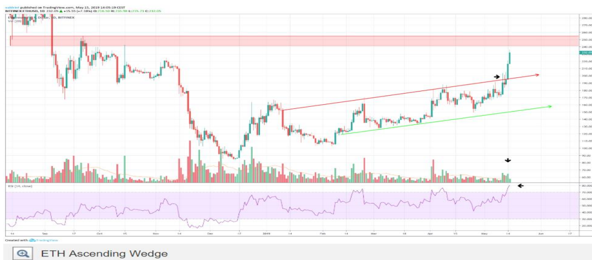
Grafikon 8: Analiza kretanja cijene Etheruma