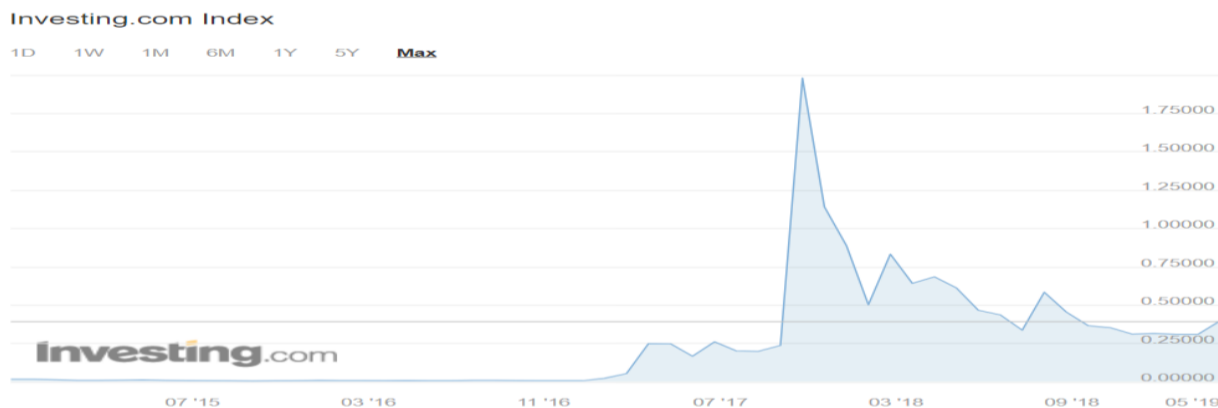
Grafikon 3: Cijena kretanja Ripplea od osnutka