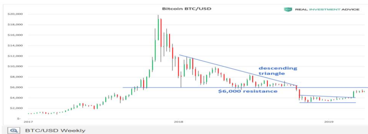
Grafikon 6: Analiza kretanja bitcoina od 2017. do 2019. godine

Siječanj 2017. godine također donosi pad vrijednosti bitcoina za 12%, na 797 USD, ali se te godine radi uglavnom o uzlaznoj putanji bitocina. Cboe Global Markets, američka burza financijskih izvedenica, izdaje prvu budućnosnicu (futures ugovor) na bitcoin, američka burza za trgovanje derivatima Chicago Board Options Exchange (CBOE) je počela trgovati izvedenicama bitcoina. Dakle, radi se o prvoj financijskoj instituciji starog kova, podložnoj strogoj regulaciji, koja je ponudila mogućnost investiranja u bitcoin, uz streloviti i značajan rast vrijednosti u 2017. godini do 15.000 USD za jedan bitcoin.