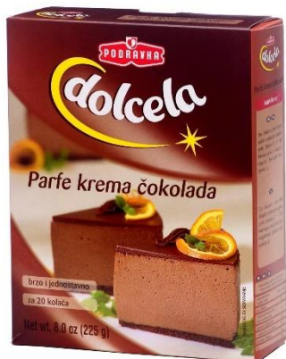
Slika 4: 1. Proizvodi Podravke d.d.

Ime kompanije Podravka potječe od naziva za stanovnicu Podravskog kraja, u kojem se nalazi sjedište tvrtke. Nastala je 1947. godine na temeljima nekadašnje tvornice pekmeza i prerade voća- Wolf, te kasnije postala poznata u zemlji i inozemstvu po proizvodnji univerzalnog dodatka jelima- Vegeti, koja se već pola stoljeća izvozi u više od 40 zemalja svijeta na svih 5 kontinenta. Podravku danas kupci prepoznaju, ne samo po brandu Vegeta već i po nizu brandova: Dolcela, Lino, Eva, Fant, Kviki, itd. Logotip Podravke mijenjao se tijekom godina. Dominantna boja, posebno u posljednjih trideset godina, je jarko crvena na bijeloj podlozi. Crvena u spektru boja spada u one tople, a kako je riječ o prehrambenoj industriji, posve je razumljiv odabir tople boje koja pozitivno utječe na emocije ljudi. Najdugovječniji Podravkine slogani bili su „Od srca srcu“, te „Kompanija sa srcem“, a godinama se u kampanjama koristio slogan „Kad se srcem kuha, kuha se Podravka juha“. Srce je, osim u znaku kompanije, simbolički korišteno i kao izvor emocija čovjeka, a poznato je da hrana u životima mnogih ima i značenje izvora velikog spektra zadovoljstva.(Podravka, 2018a)