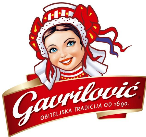
Slika 3 - Gavrilović logo