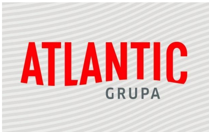
Slika 2 - logo Atlantic Grupe