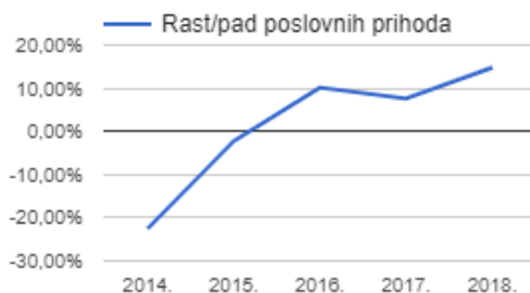
Grafikon 3 - rast i pad poslovnih prihoda tvrtke Gavrilović u razdoblju od 2014. do 2018.g.