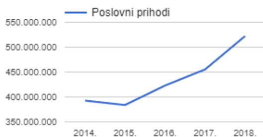
Grafikon 2 - poslovni prihodi tvrtke Gavrilović u razdoblju od 2014. do 2018.g.

pogona se nalazi u susjednoj Bosni i Hercegovini. Prema idućem grafu se mogu vidjeti ostvareni poslovni prihodi u razdoblju od 2014. do 2018. godine. Može se prema ovome grafu zaključiti da su prihodi blago pali tijekom 2015. godine, ali se zato vidi rast koji se nakon blagog pada nastavlja sve do 2018.g. Zadnji dostupni podaci poput ovog grafa nam mogu prikazati da je Gavrilović s prijelazom generacije postao samo bolji u svome poslovanju, te da ih ni recesija nije mogla zaustaviti. ( https://www.fininfo.hr/ )