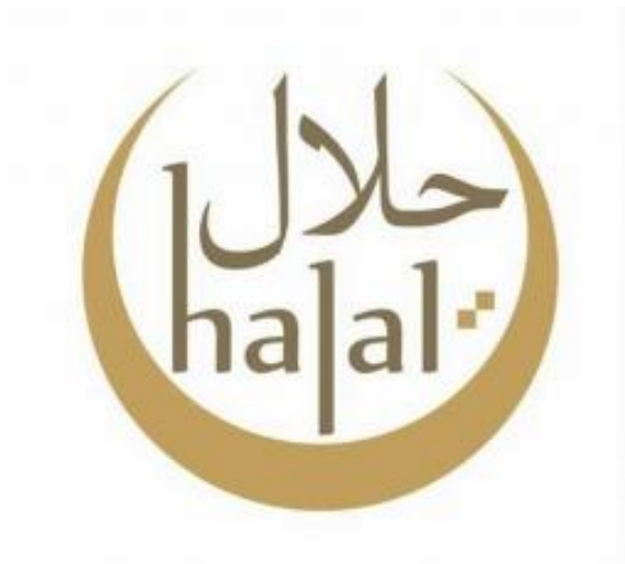
Slika 5 - „halal“ oznaka i certifikat