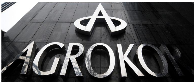
Slika 1 - sjedište tvrtke Agrokor

Izvori: preuzeto s weba, službena stranica Agrokora.