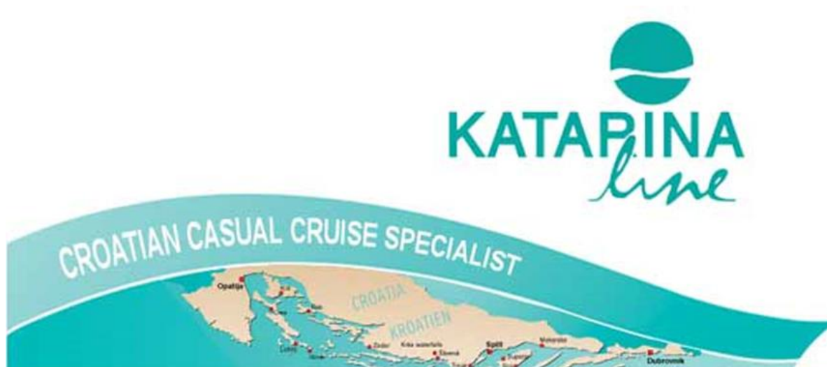
Slika 2. Katarina line logo i povezanost sjevera i juga Hrvatske brodovima