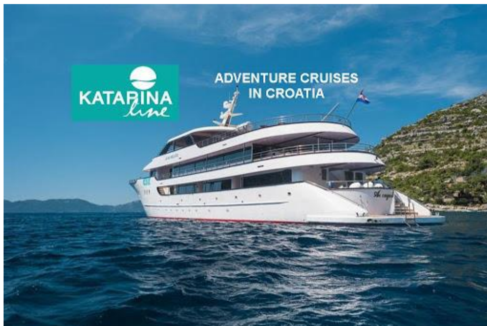
Slika 4. Avantura u Hrvatskoj