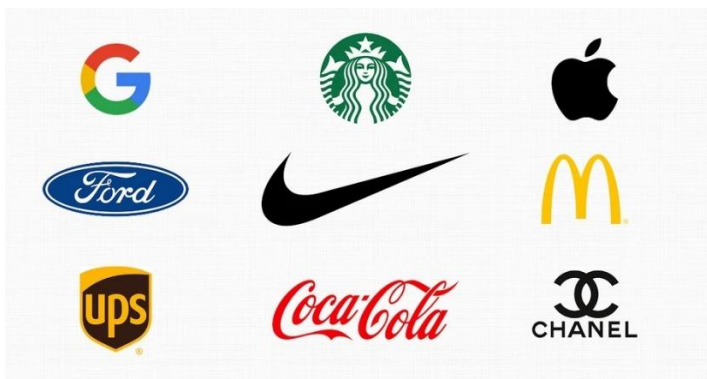
Slika 1. Simboli najpoznatijih marki