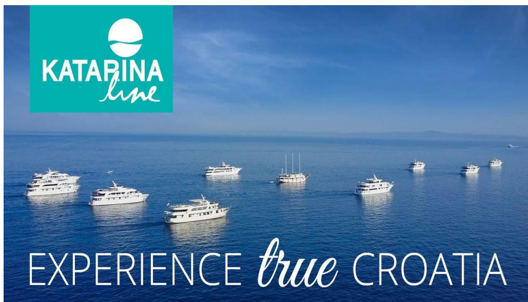
Slika 3. Flota brodova Katarine line