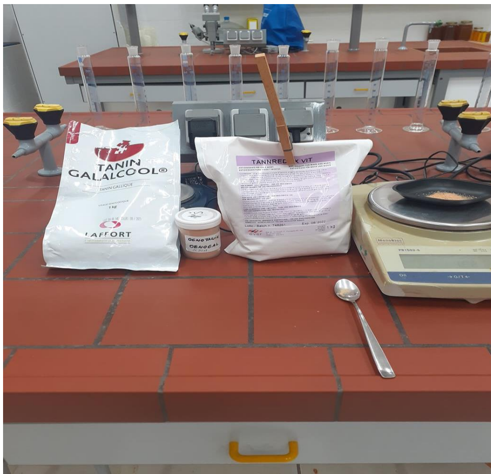
Slika 7. Korišteni tanini u pokusu

kisika, omogućuje sprječavanje nastanka , formiranja i povećanja žutih tonova u tretiranim vinima. Tannredoks vit posjeduje 59 % čistoće.