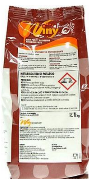
Slika 5. Kalijev metabisulfit (Enartis)

Kalij metabisulfit (K 2 S 2 O 5 ) - kalijev metabisulfit bijeli je prah koji se najviše koristi u enološke svrhe jer pospješuje čišćenje mošta i vina, otapa polifenole, antioksidacijski djeluje na oksidacijske enzime, snižava kiselinu te antiseptički djeluje na neželjene bakterije.