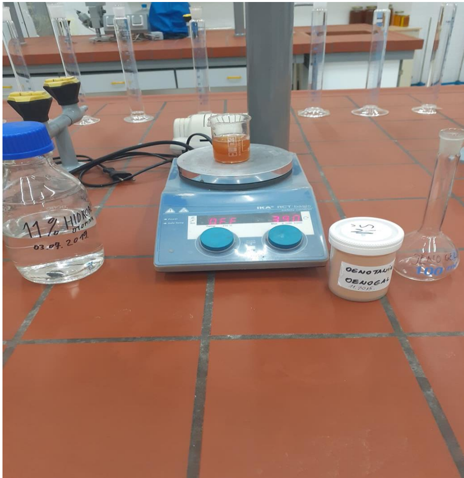
Slika 8. Priprema otopine tanina