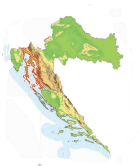
Slika 3. Rasprostranjenost sorte Žlahtina