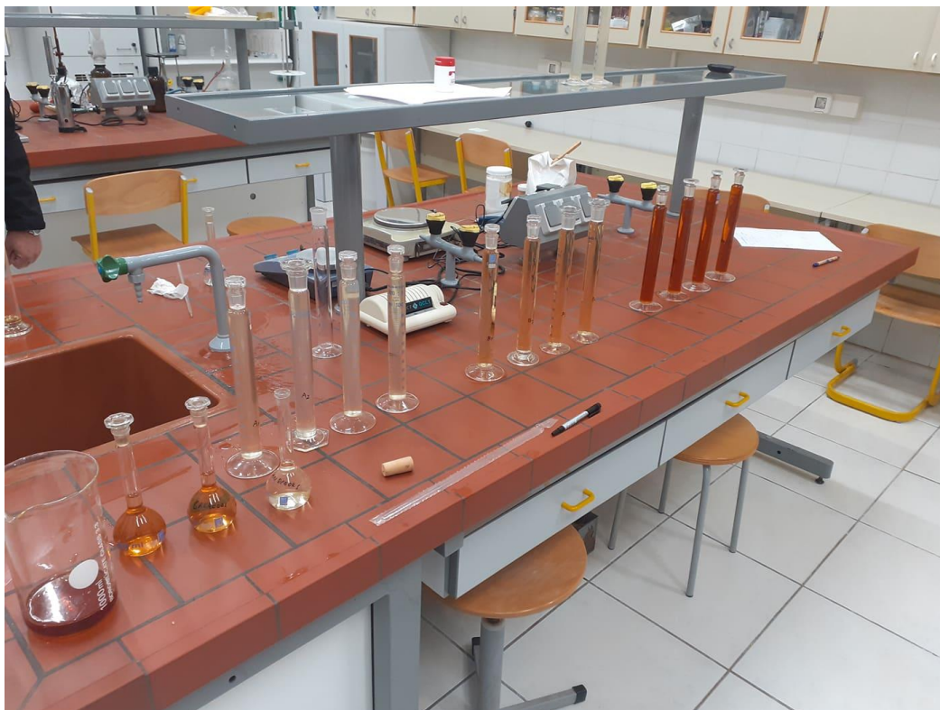
Slika 9. Laboratorijske probe u malo