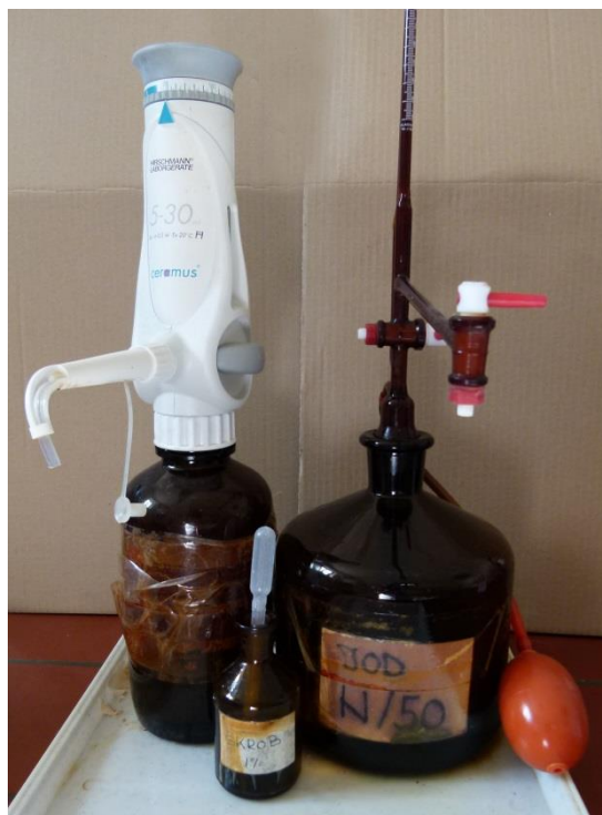
Slika 10. Otopine za određivanje slobodnog SO 2 po Ripperu