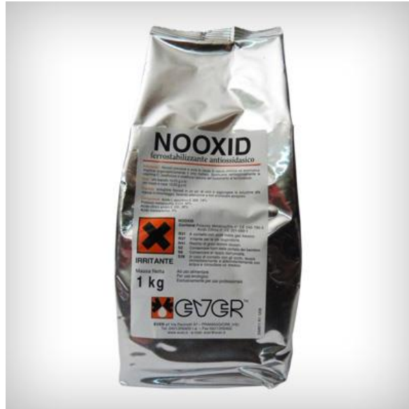
Slika 6. Nooxid (Ever)

Nooxid (Ever) - kombinacija kalijevog-metabisulfita i askorbinske kiseline. Nooxid generira brzo smanjenje redox potencijala vina i povećanje molekularnog SO 2 , povećava njegovu antiseptičku sposobnost prema mikroorganizmima.