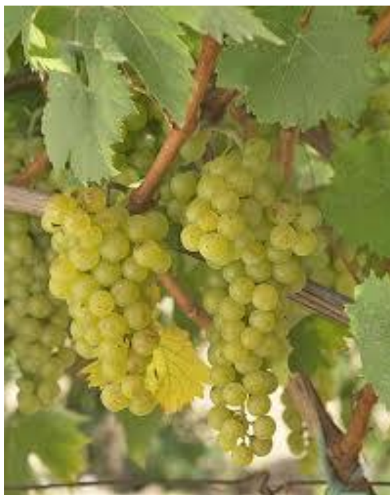
Slika 2. Malvazija istarska

Zreli grozd je srednje veličine, cilindrično-koničan, ponekad razgranat, s jednim krilcem. Srednje je zbijen, a ponekad i rastresit. Peteljka grozda srednje je duljine, odrvenjela samo pri bazi (uz mladicu), a ostatak peteljke je zeljast i meke građe, s jednim krhkim koljencem u sredini. Zrele bobice su srednje veličine, mase oko dva grama ili nešto više, okruglastog oblika, zelenkastožute boje, na sunčanoj strani zlatnožute ili sa smeđeljubičastim mrljama te s jasno izraženom pupčanom točkom smeđe boje. Mašak na kožici dobro je izražen i svijetlosive je boje. Kožica je tanka, ali čvrsta, a meso sočno. Na dobrim, osunčanim i nagnutim položajima sok je sladak i blago aromatičan, dok je kod uzgoja u udolinama i slabo osunčanim položajima bez osobita okusa (Maletić, 2015).