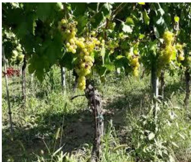
Slika 4. Grozd sorte Žlahtina

obilno oprášena i posuta gustim smeđim točkicama. Meso je sočno i užitno (Mirošević i Turković, 2003). Rozgva je duga, debela, dugačkih, žutosmeđih članaka i zadebljelih crvenkastih koljenaca. Rast je vrlo bujan (Mirošević i Turković, 2003.). Visoke prinose postiže u uvjetima plodnih tala, a najbolju kakvoću jedino daje u toplim i oskudnim tlima izrazite mediteranske klime. Oplodnja je neredovita, rado se osipa i dozrijeva u III. razdoblju (Mirošević i Turković, 2003).