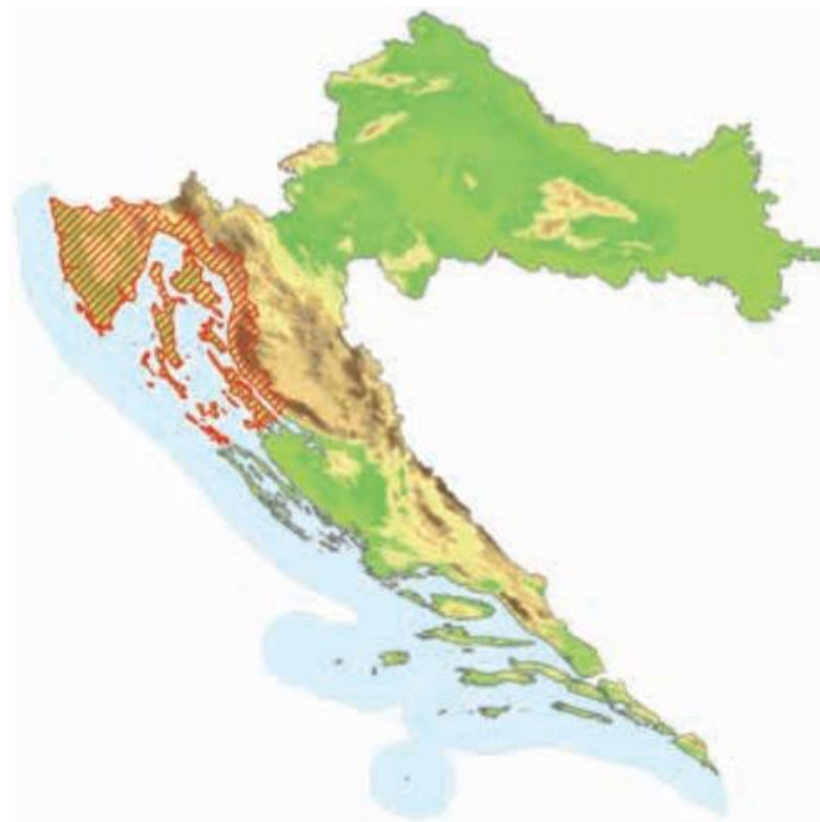
Slika 1. Rasprostranjenost sorte Malvazija istarska