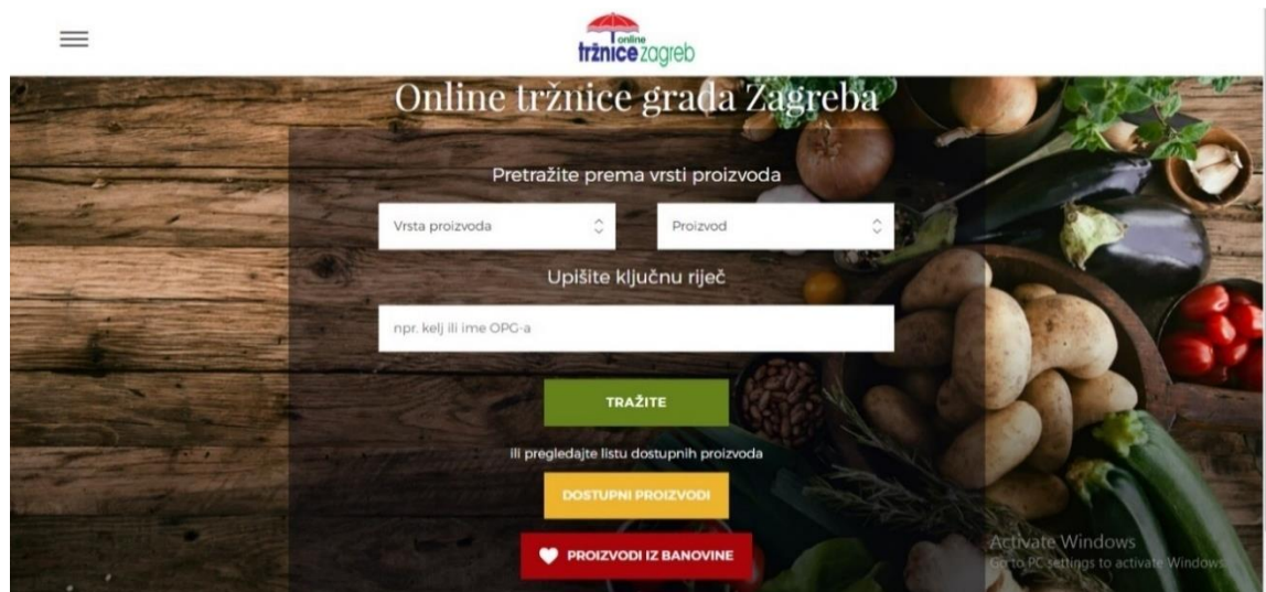
Slika 3: Prikaz tražilice na Online tržnici