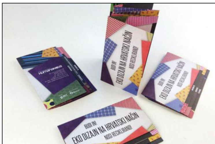
Slika 1 Rad poduzeća osnovanog od strane ACT grupe - ACT printlab