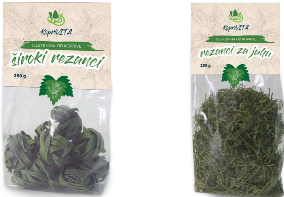
Slika 4 Proizvod udruge KopriVITA