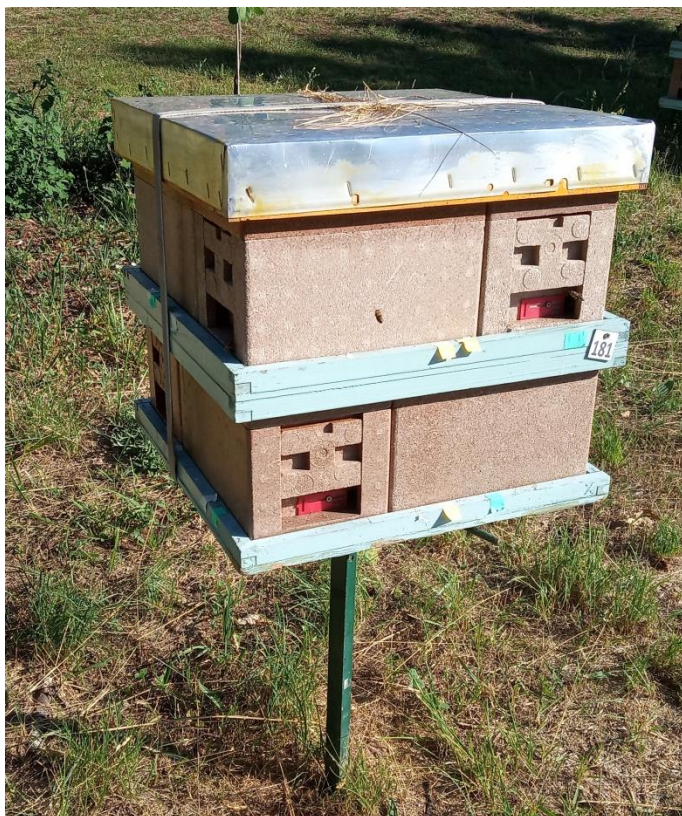
Slika 6. Set oplodnjaka

Naši setovi oplodnjaka složeni su u takozvane „osmice“. Na konstrukciji, povišeni od tla 0,5 m do 1,0 m nalaze se dva kata ili reda, a na svakom katu po 4 oplodnjaka, sve zajedno osam oplodnjaka (Slika 5.). Način slaganja ovih „osmica“ je planiran tako da se ulaz ili izlaz pčela u oplodnjak ne nalazi jedan iznad drugog. Pčela pamti poziciju svojih ulaznih vrata, te ako joj promijenimo smjer, može zabunom uletjeti u pogrešnu zajednicu ili tražeći svoju ne naći ju. Slaganjem oplodnjaka na ovaj način olakšavamo pčeli da lakše nađe svoju zajednicu. Svaki set oplodnjaka ima svoj broj kako bi se vodila evidencija.