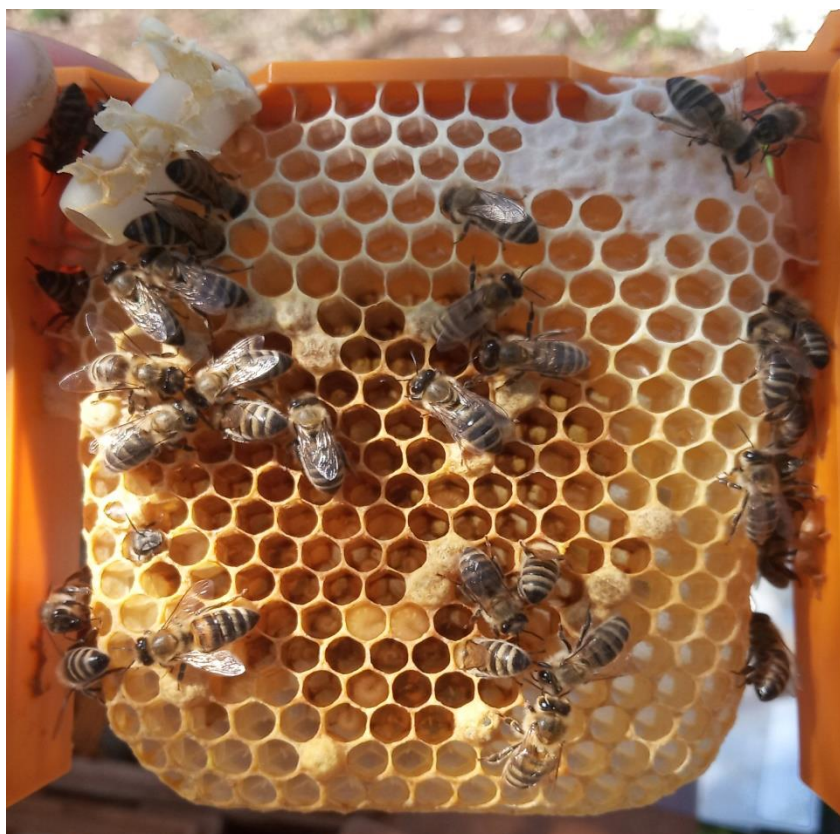
Slika 5. Okvir oplodnjaka

Tokom ispitivanja i rada s oplodnjacima nailazi se na razne bolesti i štetočinje, u našem slučaju na napade voskovog moljca. U slučaju takvog napada, potrebno je uništiti žive ličinke te dezinficirati cijeli oplodnjak. Zbog materijala i veličine higijena u oplodnjaku se vrlo lako održava. Klizni pod olakšava čišćenje i higijenu oplodnjaka. Otvaranjem kliznog poda uklonimo nakupljenu nečistoću, a dezinfekciju zaraženog oplodnjaka provodimo zamrzavanjem cijelog oplodnjaka ponekad zajedno s hranom na minus 18 ° C tijekom 24 sata.