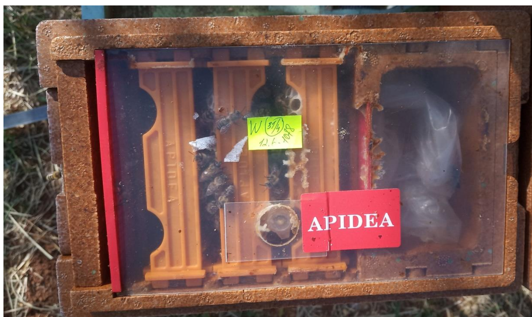
Slika 4. Okviri i hranilica oplodnjaka s prozirnim poklopcem

Stiropor se pokazao kao odlično rješenje zbog sposobnosti održavanja mikroklimе pčelinje zajednice u toplim i hladnim danima. Nema pregrijavanja tokom ljetnih vrućina što uvelike doprinosi visokom postotku oplodnje matice odnosno samoj snazi pčelinje zajednice unutar oplodnjaka. Održavanje mikroklimе u oplodnjaku olakšano je u izrazito toplim ljetnim i hladnim zimskim danima. Stiropor se pokazao odličnim i zbog svoje težine. Lako se prenosi i uvelike olakšava rad u usporedbi s drvenim oplodnjacima. Sastoji se od kliznih ulaznih vrata, kojima reguliramo izlazak i ulazak pčela. U unutrašnjosti oplodnjaka nalaze se tri okvira i hranilica, te matična rešetka koja sprječava izlijetanje matice do njene spolne zrelosti odnosno spremnosti na parenje. Prostor hranilice se puni pogačom, hranom za pčele u obliku paste. Okvire i hranilicu pokriva prozirni poklopac sa otvorom za umetanje matice odnosno matičnjaka (Slika 4.).