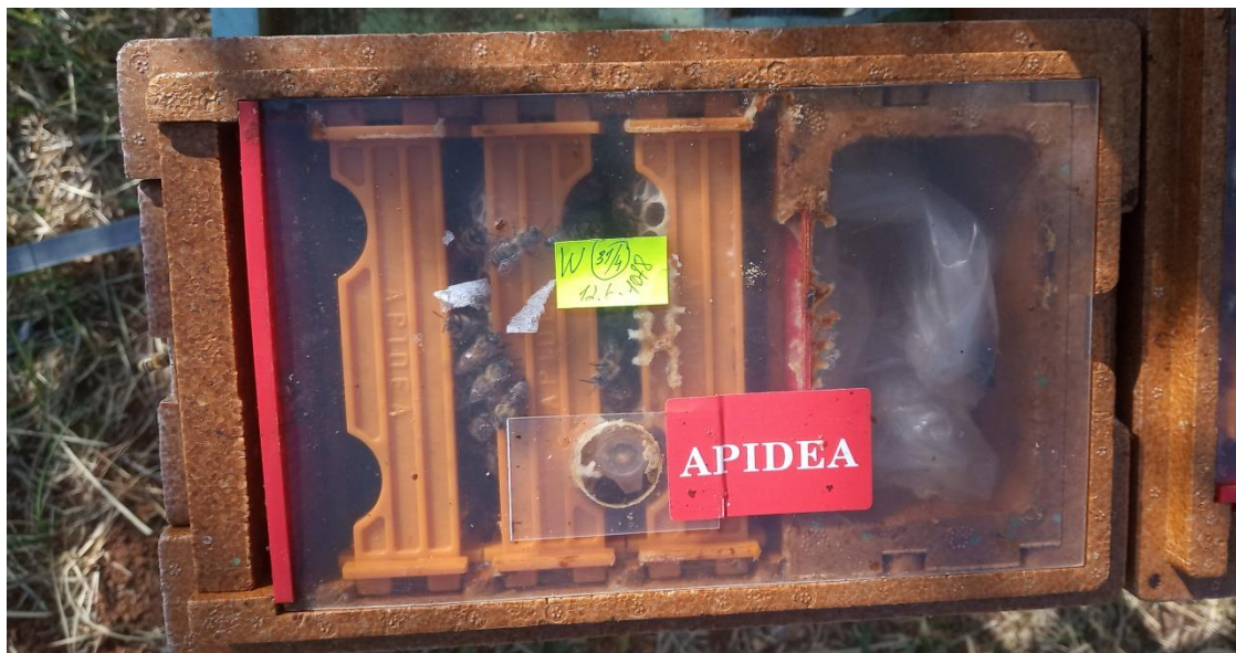
Slika 2. Oplodnjak „Apidea“

Oplodnjaci se razlikuju po svojoj veličini, konstrukciji, postotku učinkovitosti odnosno oplodnje i ekonomskoj isplativosti. Izrađeni od drva ili umjetnih materijala poput poliuretana, dolaze u raznim veličinama. Postoje mini oplodnjaci kod kojih je potrebno do 350 pčela za punjenje. Nedostatak je mali prostor koji ne zadovoljava, stoga se pojavljuje napuštanje oplodnjaka od strane pčela. Druga vrsta oplodnjaka su mini oplodnjaci s tri mini okvira, poput oplodnjaka tipa „Apidea“ (Slika 2.) korištenog u ovom istraživanju. Postotak oplodnje matice u ovakvim oplodnjacima je 85%. U jednom punjenju stane do 1000 pčela. Takvi oplodnjaci su skuplji ali isplativiji već u prvoj godini proizvodnje.