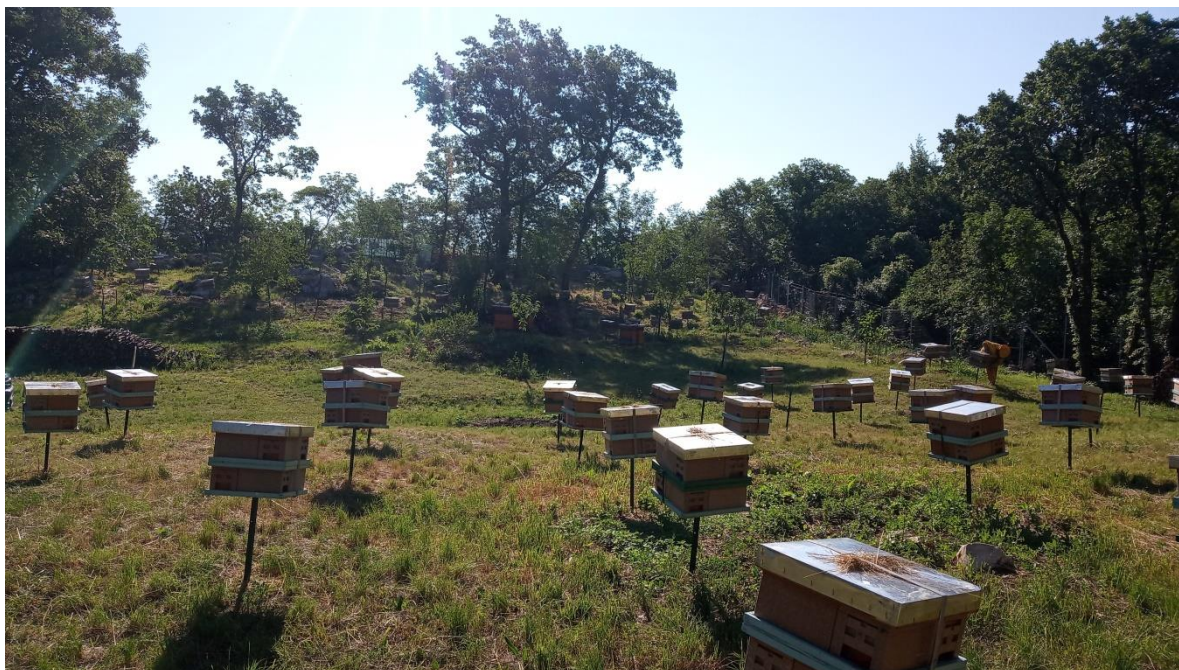
Slika 1. Oplodna stanica

Košnice za proizvodnju meda i ostalih pčelinjih proizvoda ne nalaze se na istom mjestu s oplodnjacima za oplodnju i proizvodnju matica. Oplodnjaci se nalaze na sparivalištima (Slika 1.). To su određeni dijelovi u prirodi, na kopnu ili otoku, koji su namijenjeni isključivo uzgoju matica odnosno oplodnji matica, a nazivaju se još i oplodne stanice. Takve stanice s maticama moraju biti odijeljene od ostalih pčela i tuđih trutova. U blizini ili na sparivališu potrebni su izvori nektara i peludi. Vremenski uvjeti poput dugih toplih razdoblja i brzine vjetra ne veće od 24 km/h, omogućit će dobre rezultate u uzgoju. Poželjna su izolirana, zaštićena područja udaljena od ostalih košnica i sparivališta. Izolirani otoci poput Unija, Malog i Velikog Drvenika idealne su pozicije za sparivališta zbog kontrole majčinske i očinske strane.