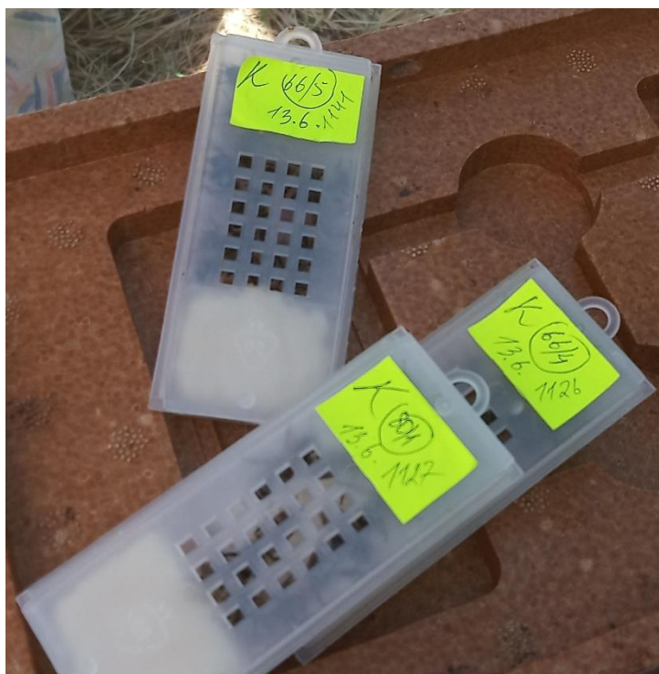
Slika 9. Transportni kavezići s pripadajućom etiketom

opalitnom pločicom i brojem. Nakon što smo se uvjerali da matica nese i vizualno procijenili da je matica zdrava, stavljamo je u transportni kavezić zajedno s pčelama radilicama. Kavezić označavamo s pripadajućom etiketom, koja sadržava broj matice, datum kada je ušla u inkubator i slovo „K“ ili „W“. Slovo „K“ na naljepnici označava matice s pčelarskog instituta u Kirchhain, u Njemačkoj, a slovo „W“ matice s pčelarskog centra Sveučilišta u Würzburgu. (Slika 9.)