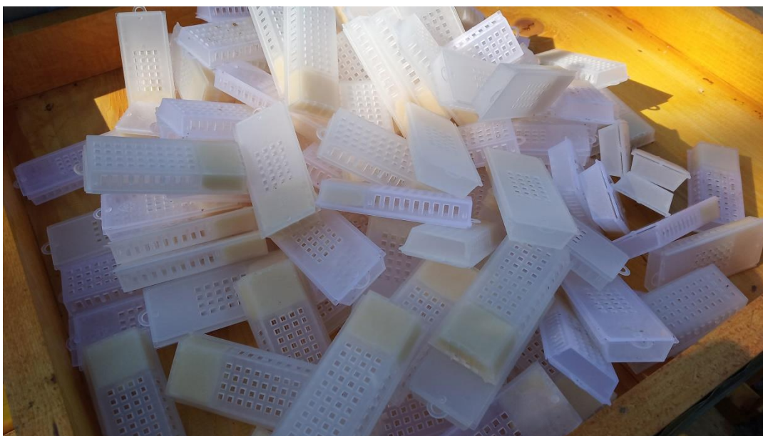
Slika 7. Transportni kavezići

Početak prikupljanja matice počinje prikupljanjem pčela. Za to su nam potrebni transportni kavezići (Slika 7.). To su mali plastični kavezići, koji imaju klizna vratašca te dva odjeljka različite veličine. Manji dio kavezića puni se hranom, a veći dio pčelama radilicama i maticom. Hrana koju stavljamo u kavez je medno-šećerna pogača, kojom se pčele i matica hrane tokom transporta. U svaki kavez napunimo od 7 do 12 pčela radilica. Pazeći da ne napunimo truta. Tako spremni kavezi služe nam za spremanje uhvaćenih matice i njihov daljnji transport. Preporuča se čuvati sakupljene pčele i matice na tamnom mjestu i sobnoj temperaturi.