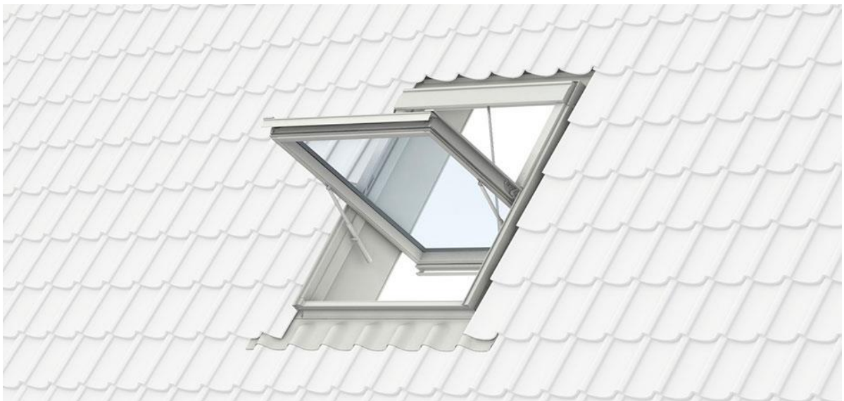
Slika 11: Prozor za odimljavanje