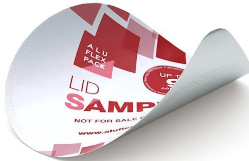
Slika 4: Aluminijski poklopac