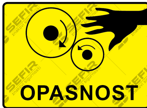
Slika 8: Znak opasnosti od rotirajućih dijelova