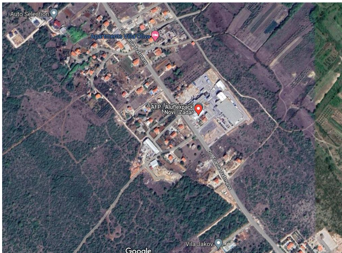
Slika 1: Lokacija tvrtke u Zadru