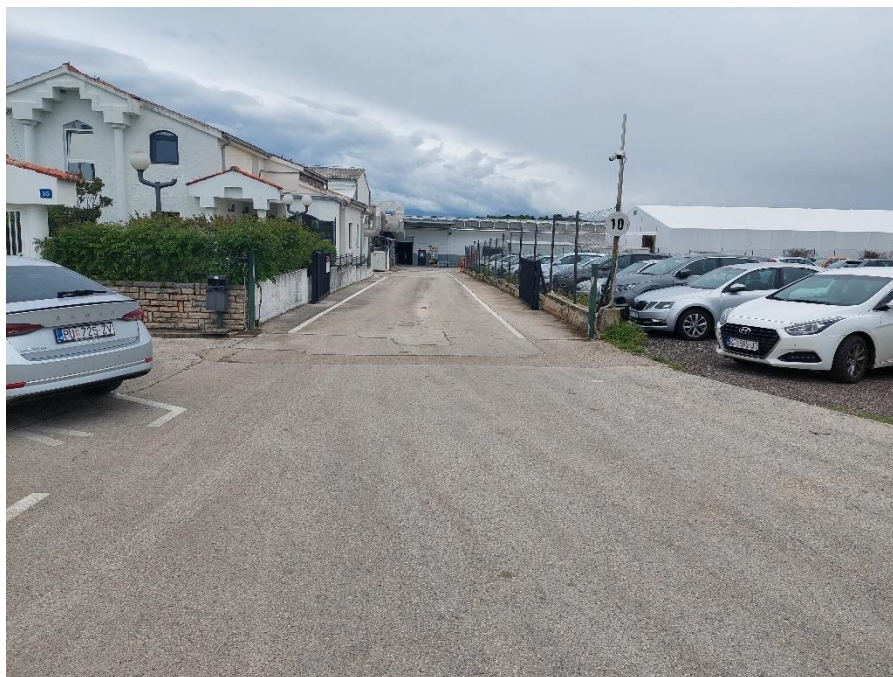
Slika 13: Mjesto okupljanja ljudi za vrijeme procesa evakuacije

Dana 2.5.2023.g. u navedenoj tvrtki odrađena je vježba evakuacije i spašavanja. Svi radnici prilikom dolaska na radno mjesto su bili obavješteni o načinu i izvođenju navedene vježbe. Vježba se izvodila u svim halama u jutarnjem terminu. Hala 1, 2 i 3 je vježbu izvodila u terminu od 10:00 do 10:30, dok su hala 4 i 5 vježbu izvodili u vremenu od 10:30 do 11:00. Mjerenje cijele akcije je bilo odrađeno mobilnom štopericom. U tom periodu svi strojevi i sredstva rada bili su ugašeni i nisu bili u funkciji kako bi se vježba provela na što mirniji način. Cilj vježbe bio je izmjeriti vrijeme od početka nastanka uzbune za evakuaciju do ukupnog pražnjenja hale i okupljanja ljudi na mjestu predviđenom za sigurnost (parking). Konačni rezultat je bio takav da je za navedenu halu 5- rezanje bilo potrebno ukupno 3 minute i 11 sekundi da se potpuno isprazni, što je izrazito dobar rezultat s obzirom da je u akciji provođenja sudjelovalo 68 ljudi koji su bili na radnom mjestu u toj smjeni. Rezultati mjerenja ostalih hala nisu poznati, s obzirom na to da je svaka hala imala svog voditelja koji je mjerio vrijeme pražnjenja.