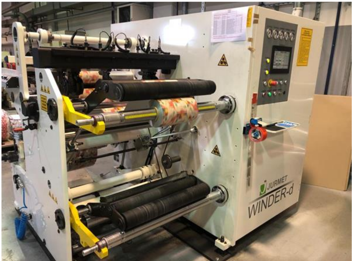
Slika 5: JURMET-WINDER