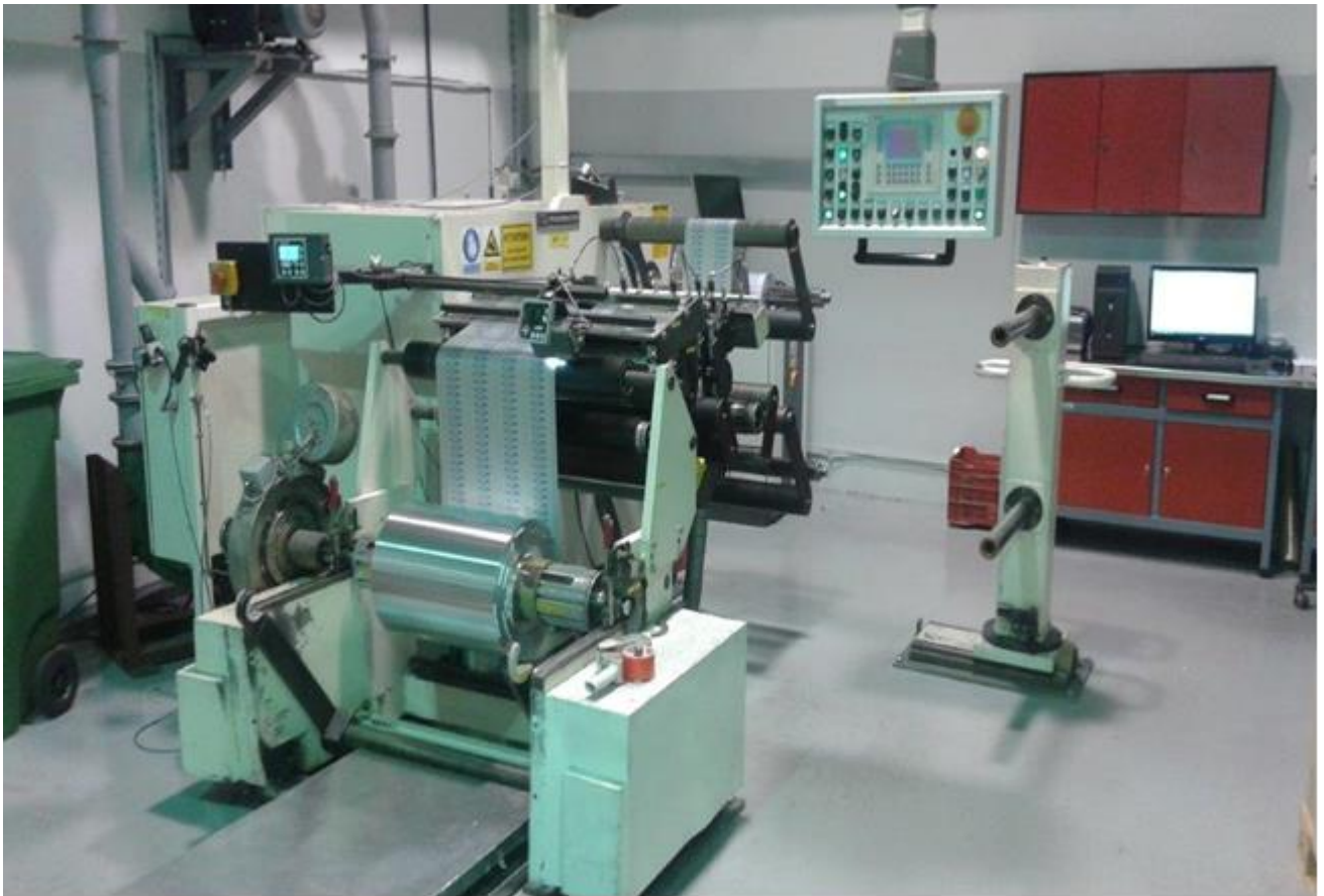
Slika 6: WT-1 (Wickeltechnik I)