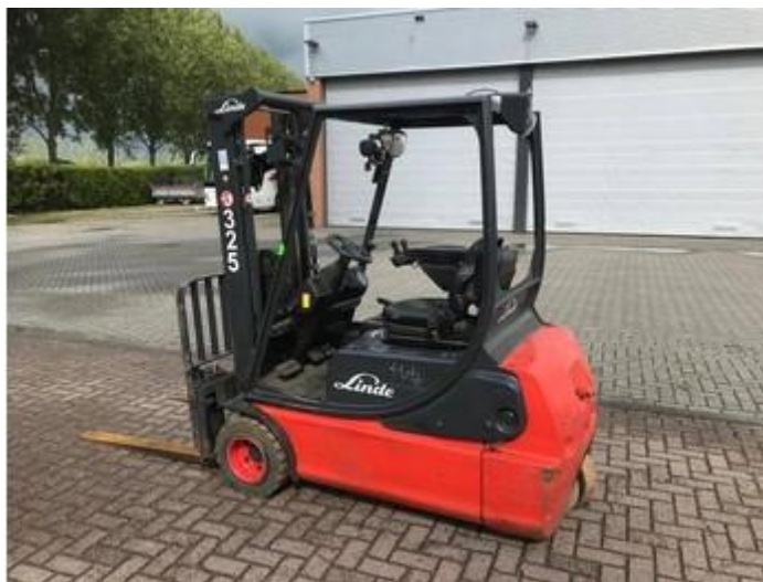
Slika 7: Čeoni viličar