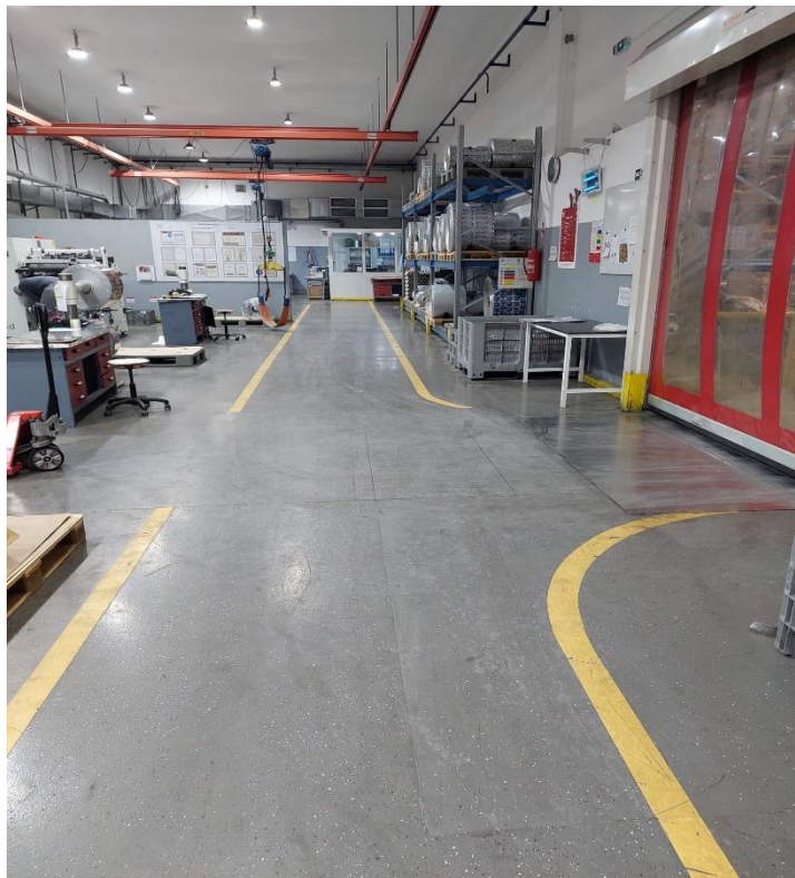
Slika 12: Prikaz označenih linija za kretanje ljudi i prijevoznih sredstava

Prometni putevi predstavljaju jedan od najvećih i najvažnijih čimbenika u svakoj tvrtki s obzirom da svakodnevno, bilo to u privatnom životu ili pri radu, koristimo površinu za kretanje. Dimenzije puteva ljudi i viličara moraju biti usklađeni s brojem radnika u tvrtki kao i sa djelatnošću poslodavca. Prema Pravilniku o zaštiti na radu za mjesta rada (NN 105/2020) minimalna širina hodnika treba iznositi 1,5m, dok širina sporednih hodnika ne smije biti manja od 1m. Prolazi na mjestima gdje su prisutni regali moraju imati minimalnu širinu od 0,8m. Zbog korištenja raznih transportnih sredstava potrebno je osigurati još veći radni prostor s obzirom da se u takvoj situaciji radi o poslovima s posebnim uvjetima rada. Transportna sredstva (viličari) u zatvorenom prostoru ne smiju imati brzinu veću od 5km/h, dok na otvorenom prostoru ograničenje iznosi 10 km/h.