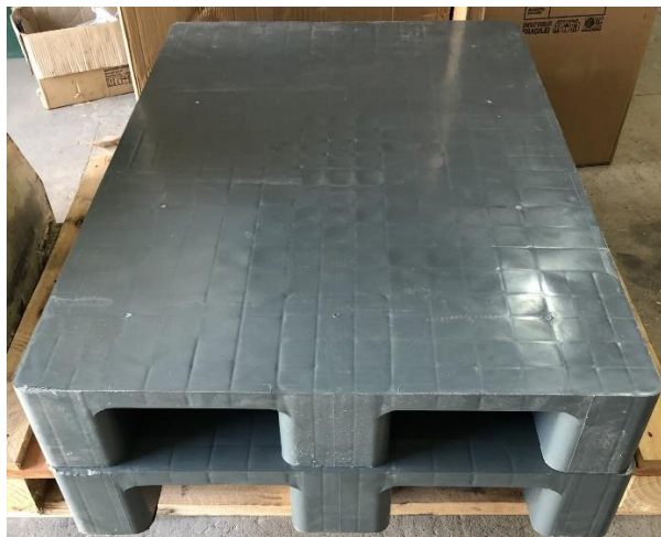
Slika 2: Plastične palete za smještaj aluminijske folije