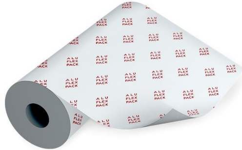
Slika 3: Aluminijska folija