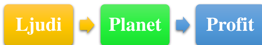
Shema 1. Model trostruke bilance