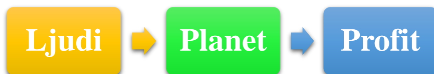
Shema 1. Model trostruke bilance