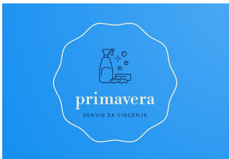
Slika 2: Logo poduzeća

Proizvod, odnosno usluga, koju nudi obrt „Primavera“ je čišćenje ili održavanje kuća za odmor, apartmana i poslovnih prostora. S obzirom da se u slučaju ovog obrta radi o usluzi, a ne o proizvodu, uložila su se sredstva u razvoj prepoznatljivog loga.