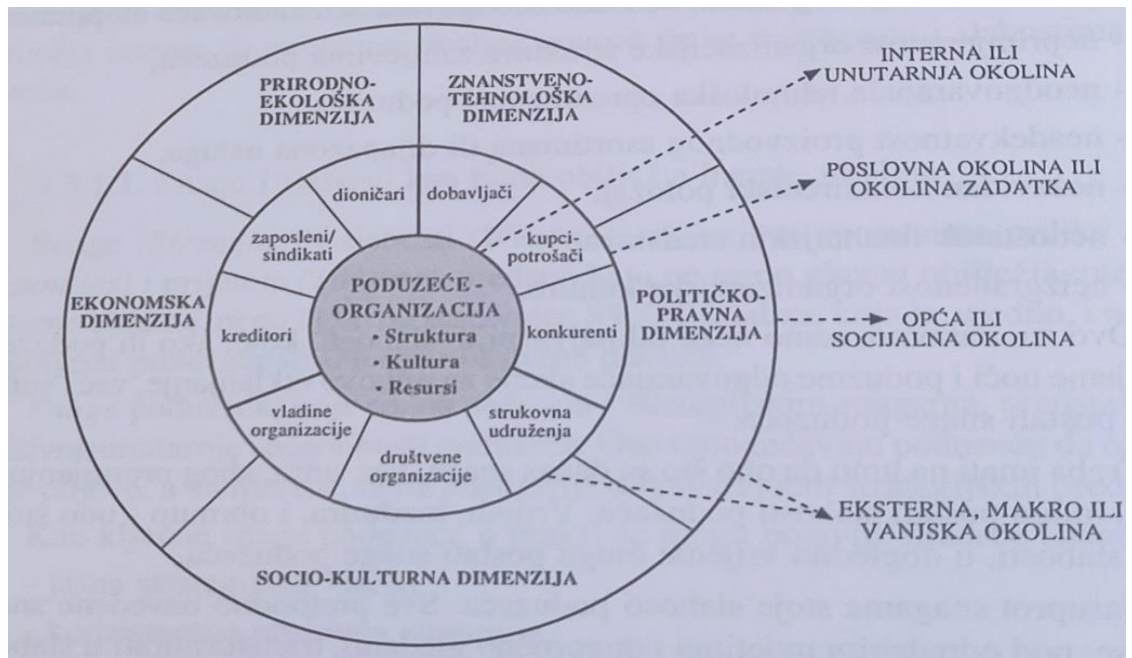
Slika 1: Ključne dimenzije interne i eksterne okoline