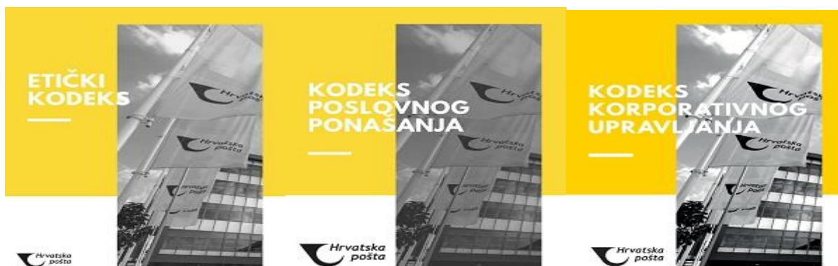
Slika 3: Temelji organizacijske kulture