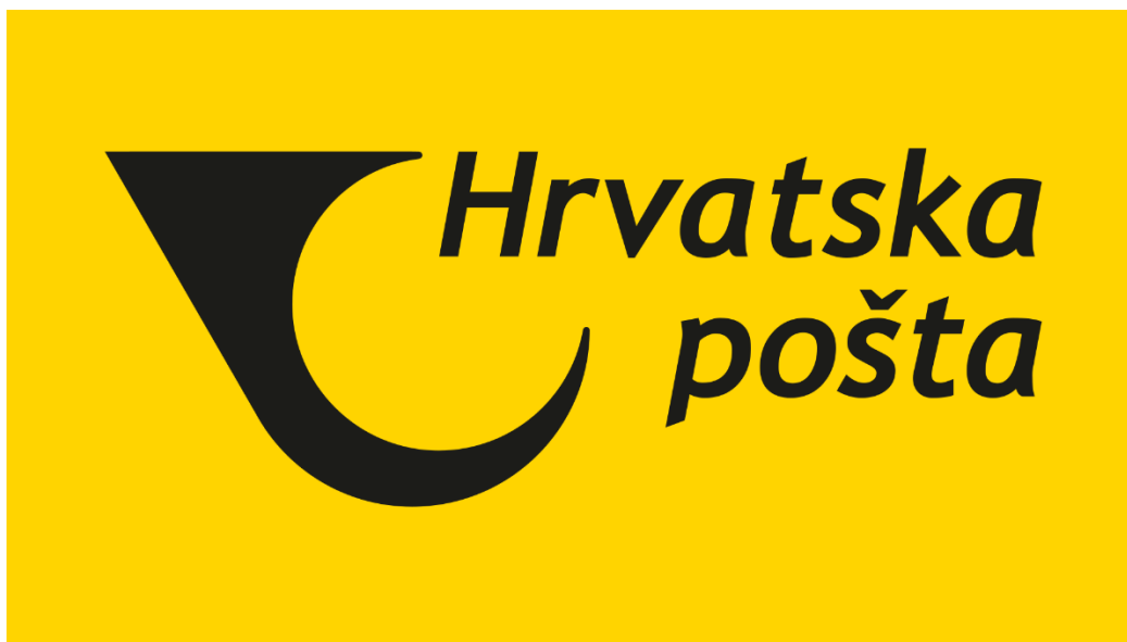
Slika 2: Logo HP-Hrvatska pošta d. d.